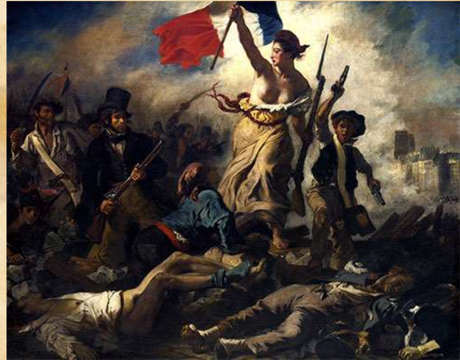
Ferdinand Victor Eugene Delacroix, «Liberty Leading the People», 1830