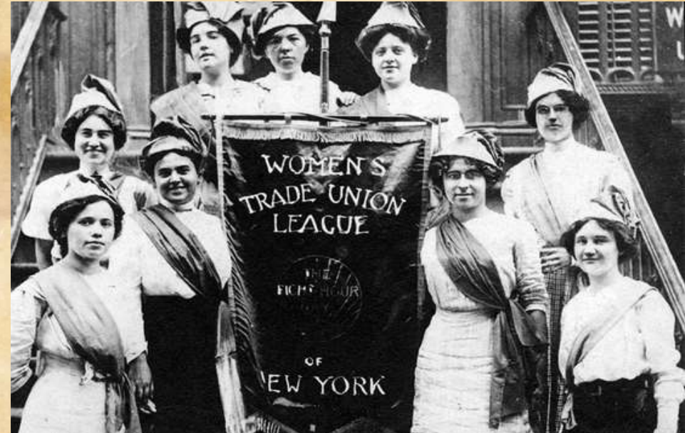
Η Πρώτη Παγκόσμια Ημέρα της Γυναίκας το 1911