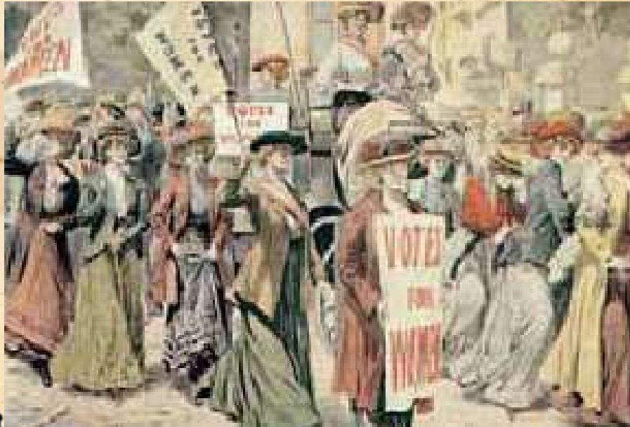
Γυναίκες διαδηλώνουν. Οι πινακίδες που κρατούν γράφουν: «ψήφο στις γυναίκες».