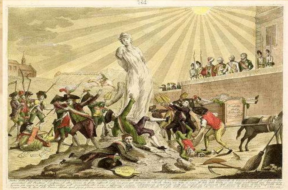
The Statue of Democracy, 1799