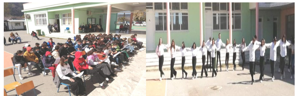
ΓΥΜΝΑΣΙΟ ΚΑΙ ΓΕΝΙΚΟ ΛΥΚΕΙΟ ΑΤΑΛΑΝΤΗΣ ΠΕΜΠΤΗ, 24 ΜΑΡΤΙΟΥ 2022

Μια πραγματικά υπέροχη γιορτή με μεγάλη συμμετοχή μαθη- τών και εκπαιδευτικών!!! Συγχαρητήρια στις μαθήτριες και μαθητές του Γυμνασίου και Λυκείου Αταλάντης καθώς και στους εκπαιδευτι- κούς για αυτή την υπέροχη εμπειρία, η οποία σηματοδοτεί την αναβί- ωση των αρχών και αξιών του έθνους. Ας ευχηθούμε να έχουμε όλοι υγεία και διάθεση ώστε να κρατήσουμε αλώβητα τα ιδανικά της πα- τρίδας μας και κάθε χρόνο να υψώνεται η γαλανόλευκη μεγαλοπρε- πής και μέσα στις πτυχές της να κυματίζει η συνείδηση του λαού μας.