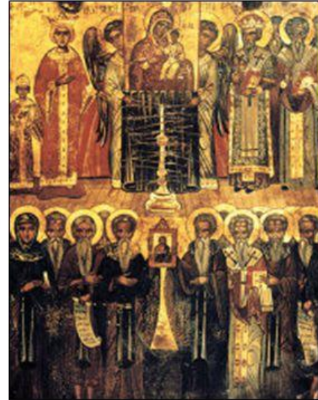
Ζ΄ οικουμενική Σύνοδος

Πώς αντιμετωπίστηκε το ζήτημα των εικόνων;