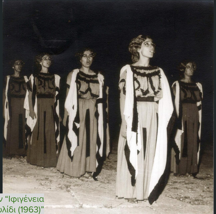
Από την “Ιφιγένεια εν Αυλίδι (1963)”

https://www.ntng.gr/Files/Internet/productions/PP0013/PP0013H0001v07.mp3