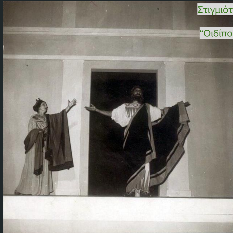
Στιγμιότυπο από την παράσταση “Οιδίπους τύραννος (1961)”

https://www.ntng.gr/Files/Internet/productions/PP0008/PP0008H0004v02.mp3