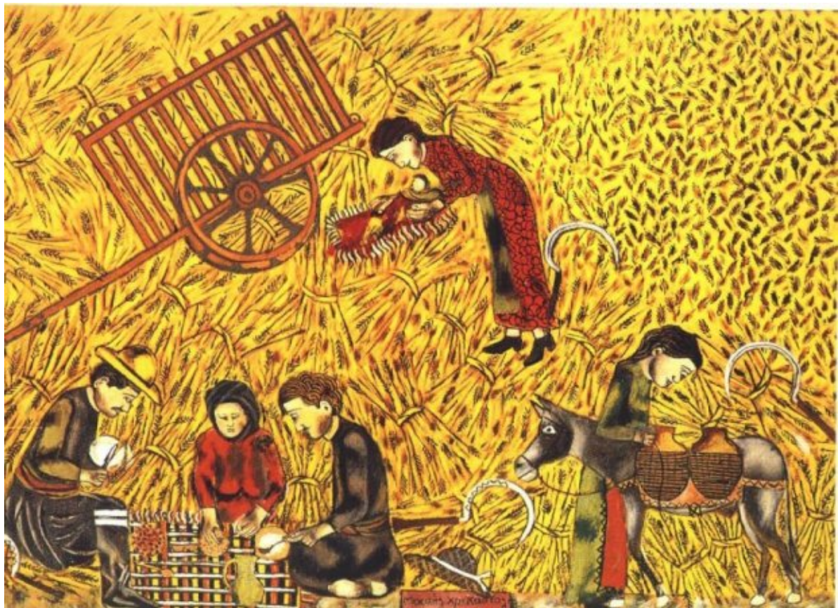
Μιχάλης Κάσιαλος, Θερίζουν και κάθονται να φαν

Τίτλος πρωτότυπου κειμένου: Θοδωρής Γεωργακόπουλος, Οι πυκνές, ατέλειωτες, αφόρητες ημέρες