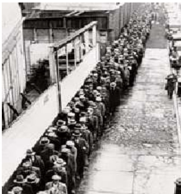
1930, Άνεργοι σε ουρά στις ΗΠΑ

δημοκρατικών αλλά με την άσκηση βίας κατά των αντιφρονούντων από ένστολους οπαδούς αυτοαναγορεύθηκε πρόεδρος του Ράιχ.