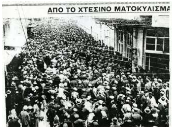
Το οι άργυρες και άλλες 4 λαές της Θεσσαλονίκης στην πύλη εισόδου των δρόμων, διακρατιζόμενος το δημοκρατικό *