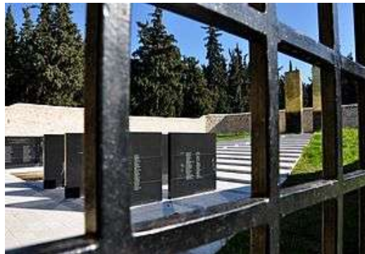
Το σκοπευτήριο της Καισαριανής

«...Μόνο θυμηθείτε το, αν η ελευθερία δε βαδίζει στα χνάρια του αίματός μας, εδώ θα μας σκοτώνουν κάθε μέρα. Γεια σας.» (Γιάννης Ρίτσος - Σκοπευτήριο Καισαριανής...).