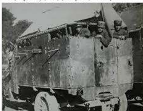
Έλληνες απεργοί εργάτες στην κλούβα το 1918

Οι οικοδομικές εργασίες που εκείνη την εποχή βρισκόντουσαν σε άνθιση, παρέλυσαν ξαφνικά. Τα μεγάλα χυτήρια μετάλλων και οι μεταφορικοί σταθμοί μπλοκαρίστηκαν. Η αντιδικία ανάμεσα στον εργοστασιάρχη Μακ Γκόρμικ και τους εργάτες χρονολογείται από τα μέσα Φεβρουαρίου όταν η επιχείρηση κήρυξε λοκ-άουτ ενάντια στους 1.400 υπαλλήλους, αντιμετωπίζοντας έτσι το αίτημά τους να σταματήσει η δίωξη ορισμένων συναδέλφων τους που είχαν απεργήσει παλιότερα. Η αστυνομία εξαπέλυσε την επίθεσή της το απόγευμα της Δευτέρας, 3 Μαΐου. 6.000 απεργοί