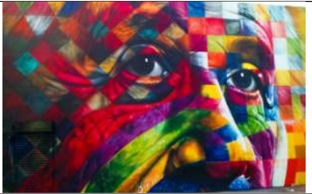
Los Angeles, USA