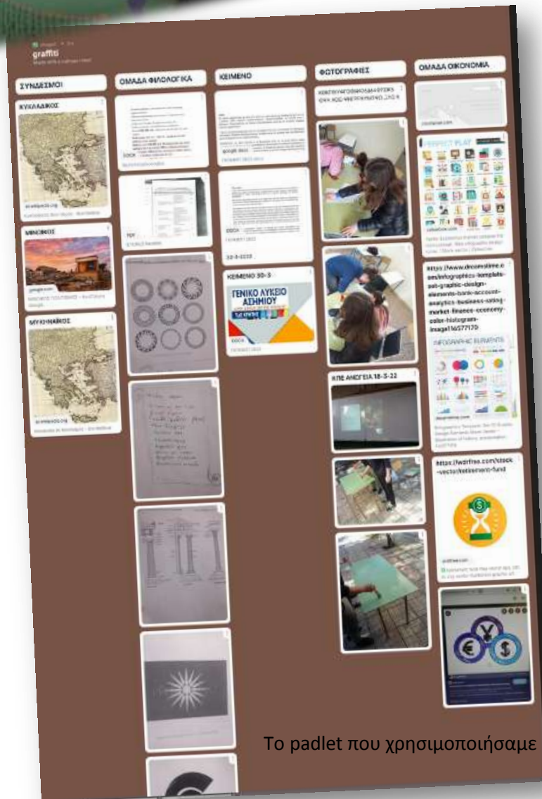
Το radlet που χρησιμοποιήσαμε