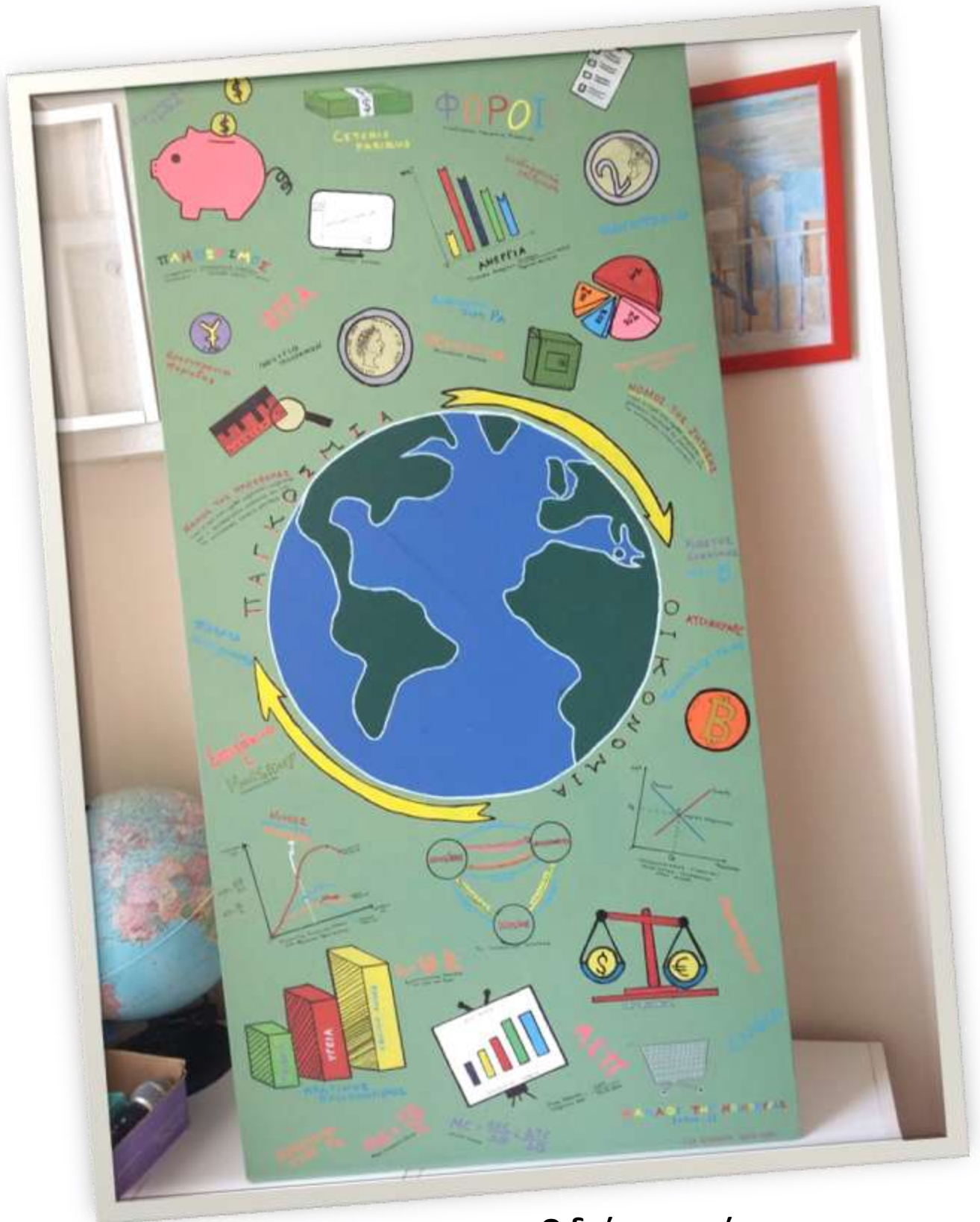
Ο δεύτερος πίνακας