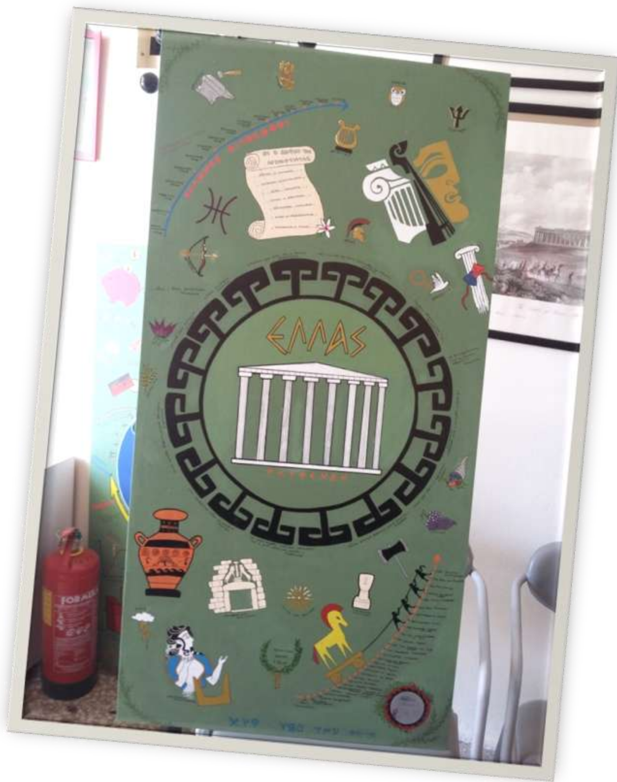
Ο πρώτος πίνακας