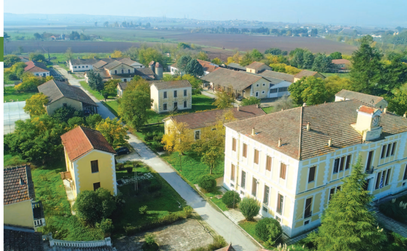
ΕΙΔΙΚΟΤΗΤΑ 2: ΤΕΧΝΙΚΟΣ ΣΥΝΤΗΡΗΣΗΣ ΚΑΙ ΕΠΙΣΚΕΥΗΣ ΓΕΩΡΓΙΚΩΝ ΜΗΧΑΝΗΜΑΤΩΝ

Επίσης, τους παρέχεται η δυνατότητα εργασίας ως στελέχη επιχειρήσεων ζωοτροφών, εξοπλισμού μονάδων εκτροφής αγροτικών ζώων ή ως σύμβουλοι κτηνοτρόφων και αγροτικών συλλογικών οργάνων για θέματα εκτροφής των ζώων τους.