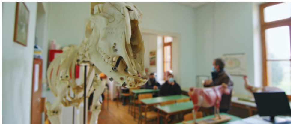
ΕΙΔΙΚΟΤΗΤΑ 1: ΔΙΑΧΕΙΡΙΣΤΗΣ ΣΥΣΤΗΜΑΤΩΝ ΕΚΤΡΟΦΗΣ ΑΓΡΟΤΙΚΩΝ ΖΩΩΝ

Στις εγκαταστάσεις της Αβερώφειου Γεωργικής Σχολής Λάρισας, σε ένα περιφραγμένο αγρόκτημα 40 στρεμμάτων με συγκρότημα 43 διατηρητέων κτηρίων, ανάμεσά τους και το εμβληματικό κτήριο της βιβλιοθήκης, το ΙΕΚ συνεχίζει την υπερεκατονταετή εκπαιδευτική ιστορία της Σχολής και λειτουργεί στον χώρο με σύγχρονες δομές εκπαίδευσης και κατάρτισης σπουδαστών για δύο ειδικότητες, που περιλαμβάνουν εργαστήρια γεωργικών μηχανημάτων και μηχανολογίας, καθώς και βουστάσιο, χοιροστάσιο, πτηνοτροφείο και καλλιεργήσιμους αγρούς.