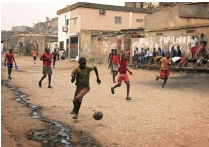
της Αφρικής παίζεται ποδόσφαιρο.

Το δημοφιλέστερο άθλημα στην Αφρική είναι αδιαμφισβήτητα το ποδόσφαιρο. Σχεδόν σε κάθε γειτονιά της Αφρικής παίζεται ποδόσφαιρο. Παρόλα αυτά σε παγκόσμιο επίπεδο δεν υπάρχει κάποια σπουδαία διάκριση. Την τελευταία εικοσαετία και ειδικότερα την περασμένη δεκαετία έγινε η μεγάλη ποδοσφαιρική έκρηξη στην ήπειρο της Αφρικής. Ποδοσφαιριστές από αφρικανικές χώρες με πλούσιο ταλέντο πήραν μεταγραφή για ευρωπαϊκούς συλλόγους και έλαμψαν με την παρουσία τους στο παγκόσμιο στερέωμα. Οι περισσότεροι από αυτούς μάλιστα προέρχονταν από χώρες της Δυτικής Αφρικής. Παραδοσιακά η Δυτική Αφρική ήταν η ισχυρότερη ποδοσφαιρικά με την παρουσία της Νιγηρίας και του Καμερούν, που εμφάνισαν ιδιαίτερα δυνατά σύνολα τη δεκαετία του 90'. Τη σκυτάλη πήρε η Σενεγάλη στις αρχές της περασμένης δεκαετίας, ενώ τα τελευταία χρόνια η Ακτή Ελεφαντοστού και η Γκάνα έχουν αναπτυχθεί σε τεράστιο βαθμό ποδοσφαιρικά. Δεν είναι τυχαίο άλλωστε το γεγονός ότι στο τελευταίο Κύπελλο Εθνών Αφρικής, οι τέσσερις χώρες που βρέθηκαν στα ημιτελικά (Νιγηρία, Μπουρκίνα Φάσο, Μάλι και Γκάνα) προέρχονταν όλες από τη Δυτική Αφρική. Δεν είναι τυχαίο ότι μεγάλοι παίκτες κατάγονται από την Αφρική όπως ο Ντιντιέ Ντρογκμπά και ο Σάμιουελ Ετό. Αξίζει να σημειωθεί ότι το 2010 ήταν η πρώτη φορά που διοργανώθηκε το παγκόσμιο κύπελλο ποδοσφαίρου στην Αφρική και συγκεκριμένα στην Δημοκρατία της Νότιας Αφρικής.