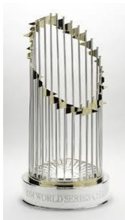
Το τρόπαιο του World Series.

Το πιο γνωστό πρωτάθλημα μπέιζμπολ είναι το MLB (Major League Baseball/Η.Π.Α.) και οι τελικοί του πρωταθλήματος αυτού (World Series) συμπεριλαμβάνονται στα μεγαλύτερα σε σημασία αθλητικά γεγονότα της χώρας.