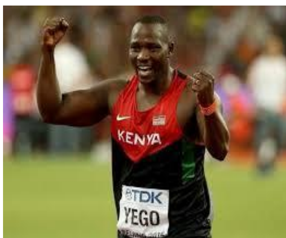
Ο Τζούλιους Γιέγκο