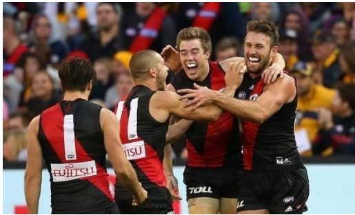
Ομάδα αυστραλιανού ποδοσφαίρου.

διαφοροποιείται σε μερικούς κανονισμούς από το παραδοσιακό ράγκμπι (όπως για το σχήμα του γηπέδου).