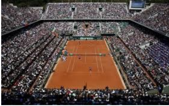
Ρολάν Γκαρός: ένα από τα πιο σημαντικά και γνωστά τουρνουά τένις στον κόσμο και διεξάγεται κάθε χρόνο στο Παρίσι.