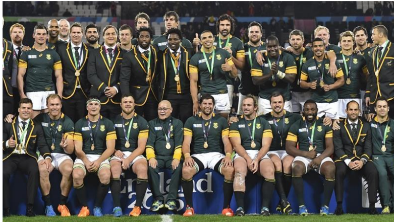
Η εθνική ομάδα ράγκμπι της Νότιας Αφρικής, μια ομάδα με αρκετές διακρίσεις σε παγκόσμιο επίπεδο.

Η Αφρική έχει παράδοση και στο ράγκμπι. Για πρώτη φορά το 1995 η νότιος Αφρική κατέκτησε το παγκόσμιο κύπελλο. Αυτό είχε και ένα ιδιαίτερο μήνυμα, καθώς εκείνη την εποχή στην Αφρική υπήρχε το απαρτχάιντ. Επίσης κατέκτησε ξανά την πρώτη θέση το 2007 και την Τρίτη το 1999 και το 2015. Βέβαια το ράγκμπι είναι ένα άθλημα κυρίως για τις πιο οικονομικά ανεπτυγμένες χώρες (νότιος Αφρική).