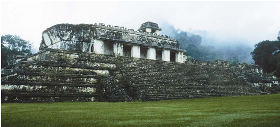
Εικόνα 1 Γήπεδο Πελότας :είναι μια μορφή των γηπέδων που λάμβανε χώρα το παιχνίδι αυτό

γήπεδα βρίσκονται σ' όλες τις πόλεις των Μάγια σε διαφορετικά μεγέθη. Οι παίχτες αφού είχαν χωριστεί σε δύο ομάδες, προσπαθούσαν χωρίς χέρια και πόδια να βάλουν καλάθι με μια πέτρινη μπάλα σ' ένα στρογγυλό δακτύλιο ψηλά στον τοίχο. Το παιχνίδι λόγω της δυσκολίας του κρατούσε πολλές ώρες. Οι νικητές του ιερού αυτού παιχνιδιού στο τέλος θυσιάζονταν. Αυτό το παιχνίδι πάντως το δανείστηκαν από τους Ολμέκους.