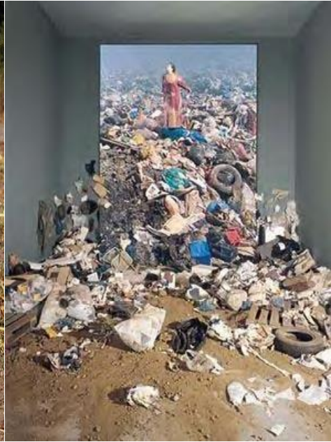
Κώστας Τσόκλης, Οι άγγελοι του μέλλοντος , 2001