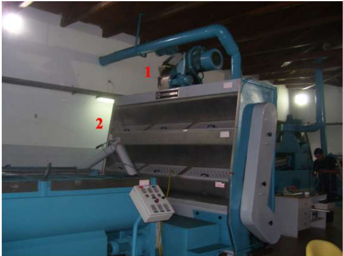
1 ΜΗΧΑΝΗ ΣΥΝΘΛΙΨΗΣ 2 ΘΕΣΕΙΣ ΖΥΜΗΣ