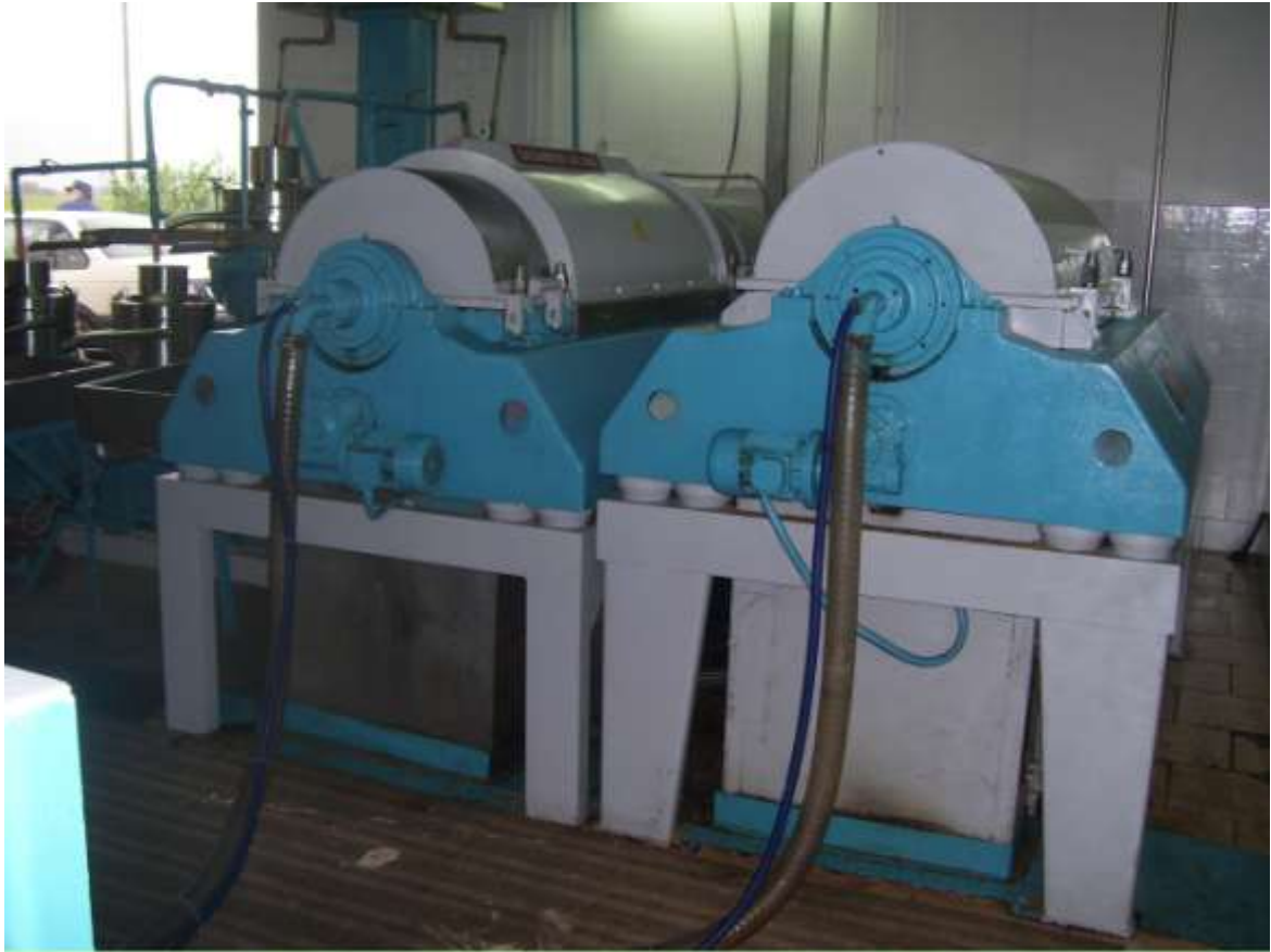
ΔΙΑΧΩΡΙΣΤΗΡΑΣ ΤΡΙΜΜΕΝΩΝ ΠΥΡΗΝΩΝ (ΚΟΥΚΟΥΤΣΙΩΝ) ΕΛΑΙΟΚΑΡΠΟΥ