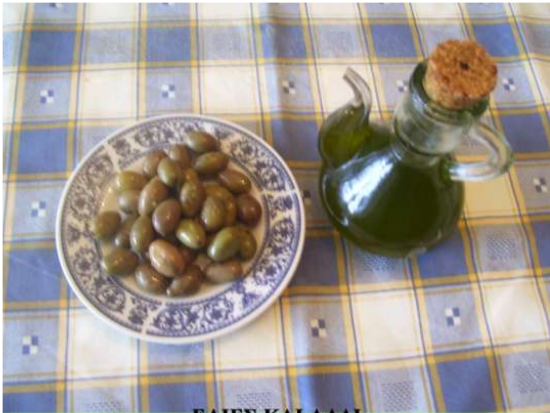
ΕΛΙΕΣ ΚΑΙ ΛΑΔΙ ΤΑ ΒΑΣΙΚΑ ΠΡΟΪΟΝΤΑ ΤΗΣ ΕΛΙΑΣ