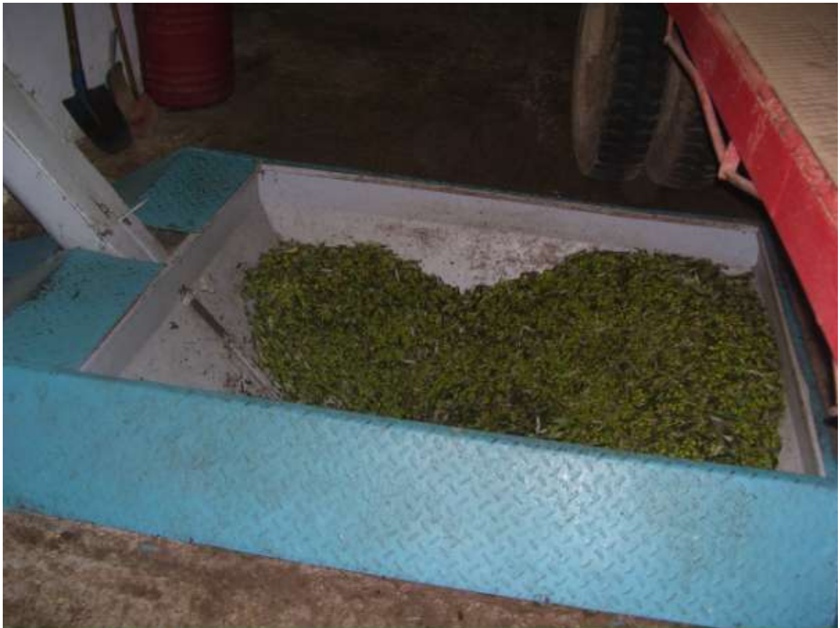
ΑΔΕΙΑΣΜΑ ΤΩΝ ΣΑΚΙΩΝ ΣΤΗ ΧΟΑΝΗ ΕΙΣΑΓΩΓΗΣ