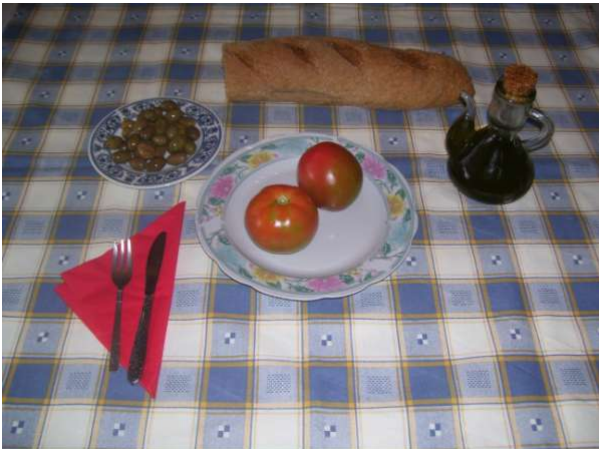
ΚΑΛΗ ΣΑΣ ΟΡΕΞΗ