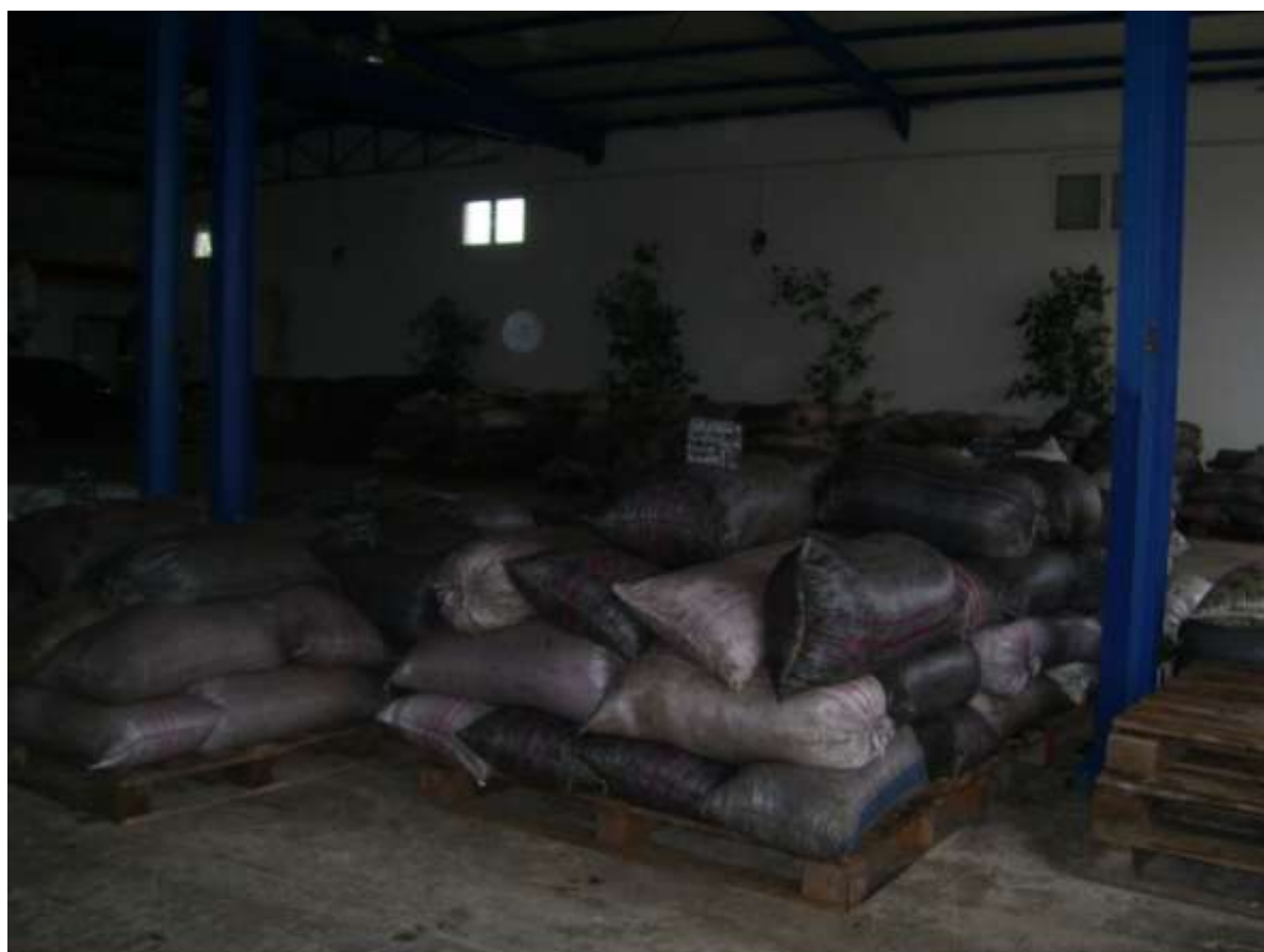
ΜΕΤΑΦΟΡΑ ΣΑΚΙΩΝ ΣΤΟ ΛΙΟΤΡΙΒΙ