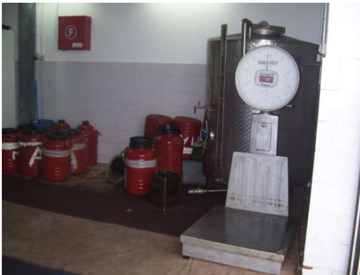
ΖΥΓΑΡΙΑ ΚΑΙ ΔΟΧΕΙΑ ΜΕΤΑΦΟΡΑΣ / ΠΑΡΑΔΟΣΗΣ ΛΑΔΙΟΥ ΣΤΟΥΣ ΠΑΡΑΓΩΓΟΥΣ