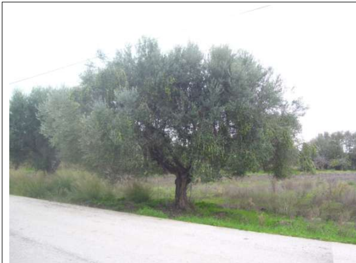
ΕΛΙΑ ΜΕ ΚΑΡΠΟ