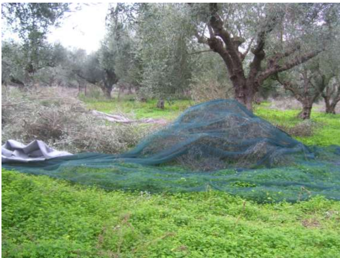
ΜΑΖΕΜΑ ΚΛΑΔΙΩΝ ΚΑΙ ΑΠΛΩΜΑ ΠΑΝΙΩΝ