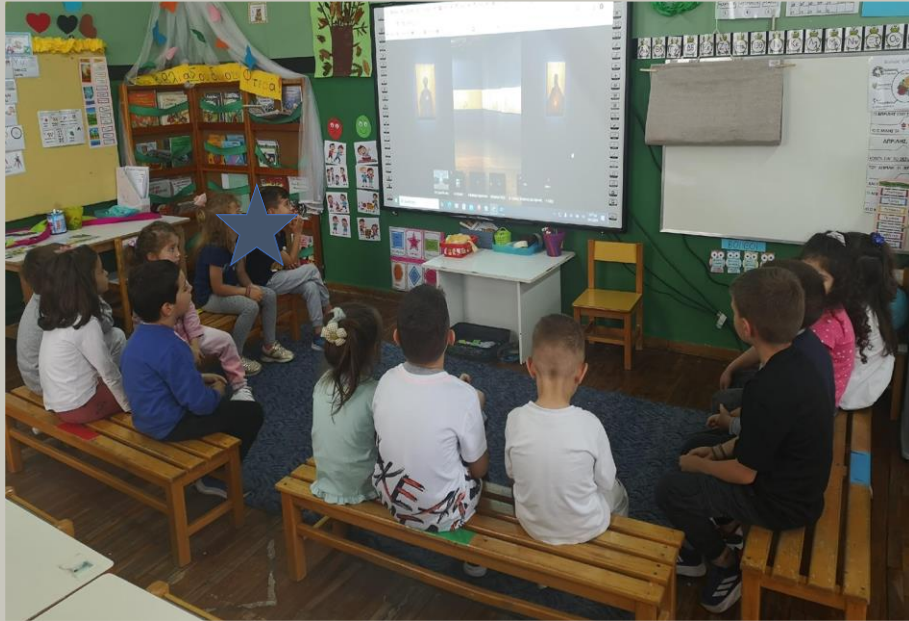
Εικονική περιήγηση στον διαδραστικό πίνακα