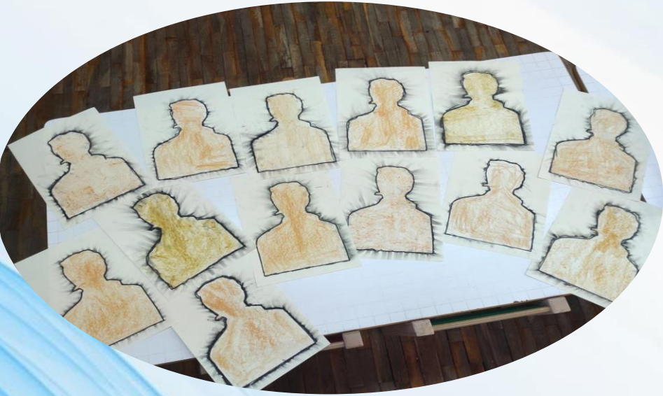
Η σκιά του Γεωργάκη Ολύμπιου