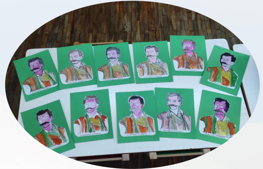
Ζωντανεύοντας τον Γεωργάκη