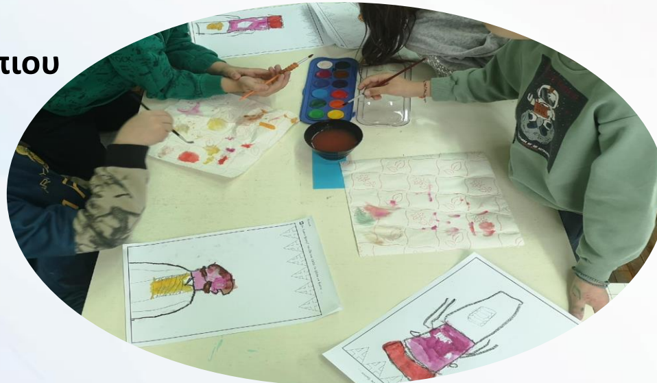
Αν ήμουν ήρωας