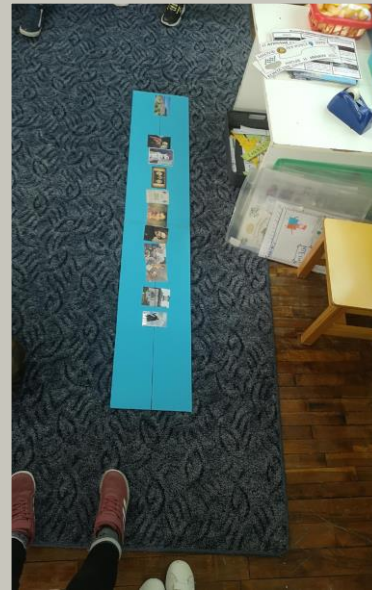
Σειροθέτηση ιστορικών γεγονότων