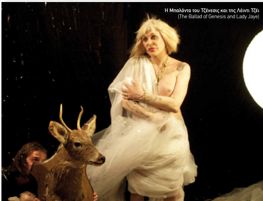
Η Μπαλάντα του Τζένεσις και της Λέιντι Τζέι (The Ballad of Genesis and Lady Jaye)