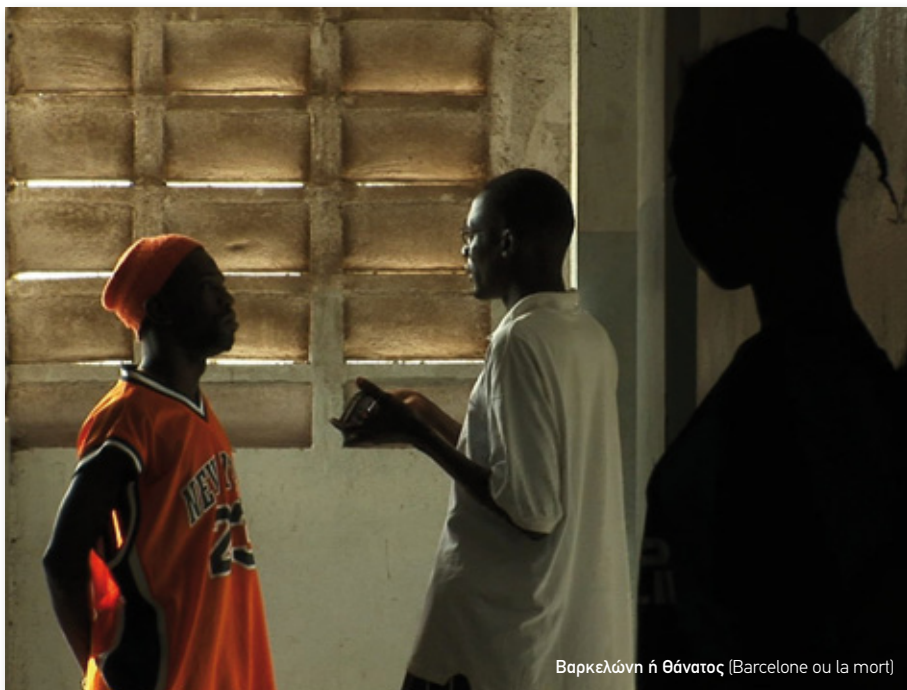
Βαρκελώνη ή Θάνατος (Barcelone ou la mort)