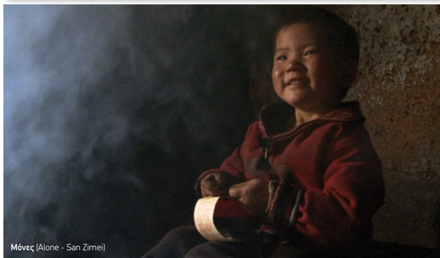
Μόνες (Alone - San Zimei)