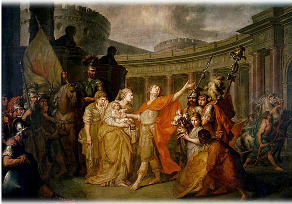
Αποχαιρετισμός Έκτορα και Ανδρομάχης. Losenko, Anton, 1773 Μόσχα, The State Tretyakov Gallery