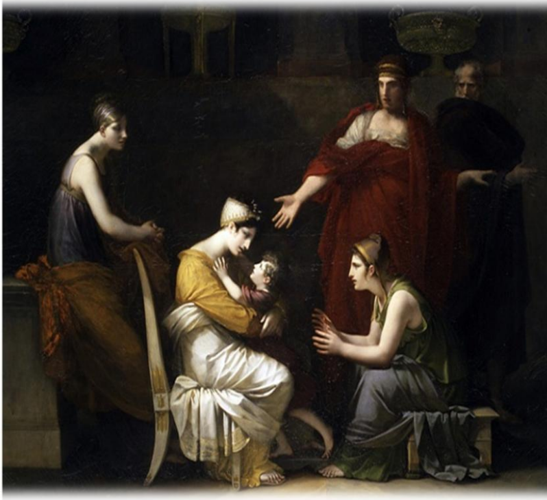
Ανδρομάχη και Αστυάνακτας. Prud'hoη, Pierre-Paul, 1814-24 Νέα Υόρκη, Μητροπολιτικό Μουσείο