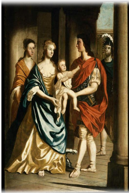
Έκτορας, Ανδρομάχη και Αστυάνακτας. Smibert, John, 1750