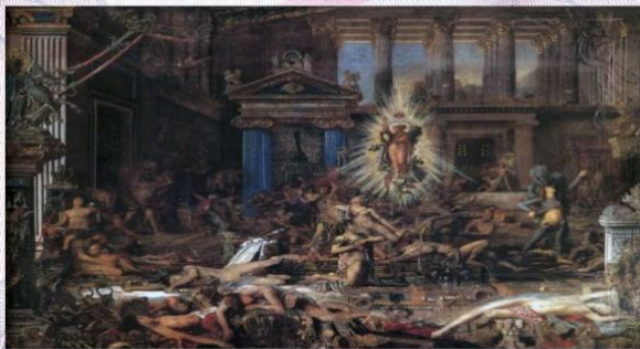
Οι Μνηστήρες, έργο του Gustave Moreau. Musée National Gustave Moreau.