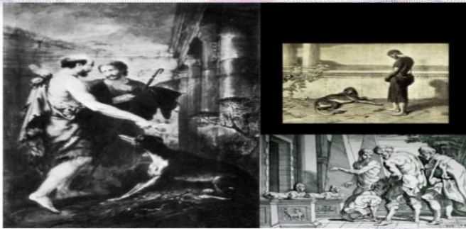
Ο Οδυσσεύς αναγνωρίζεται από τον σκύλο του Άργος. Κάτω δεξιά, σχέδιο του ιταλού ζωγράφου της Αναγέννησης Francesco Primaticcio