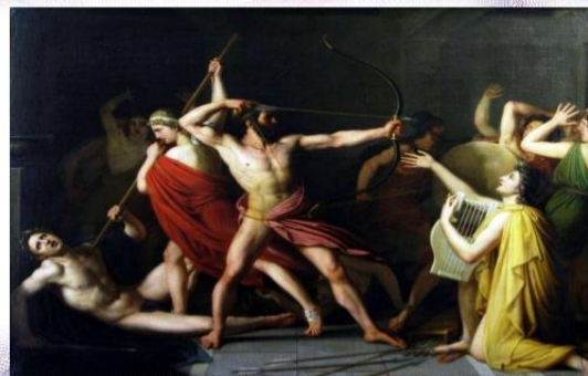
Ο Οδυσσεύς και ο Τηλέμαχος σκοτώνουν τους μνηστήρες (1812), έργο του γάλλου ζωγράφου Christophe Thomas Degeorge.