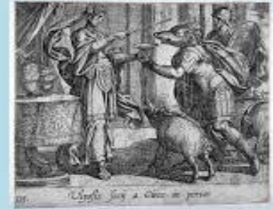
Η Κίρκη μεταμορφώνει τους συντρόφους του Οδυσσέα σε γουρούνια

Ο Οδυσσέας αποδεικνύεται ένας πολυμήχανος και γενναίος άνδρας που σκέφτεται το καλό των συντρόφων του αλλά παράλληλα είναι και ένας δύστυχος και οδυρόμενος άνθρωπος. Το ταξίδι του είχε πολλές προκλήσεις και δυσκολίες που έπρεπε να αντιμετωπίσει και διήρκησε πολλά χρόνια, κρατώντας τον έτσι μακριά από ότι επιθυμούσε πιο πολύ από όλα, την πατρίδα και την οικογένεια του.