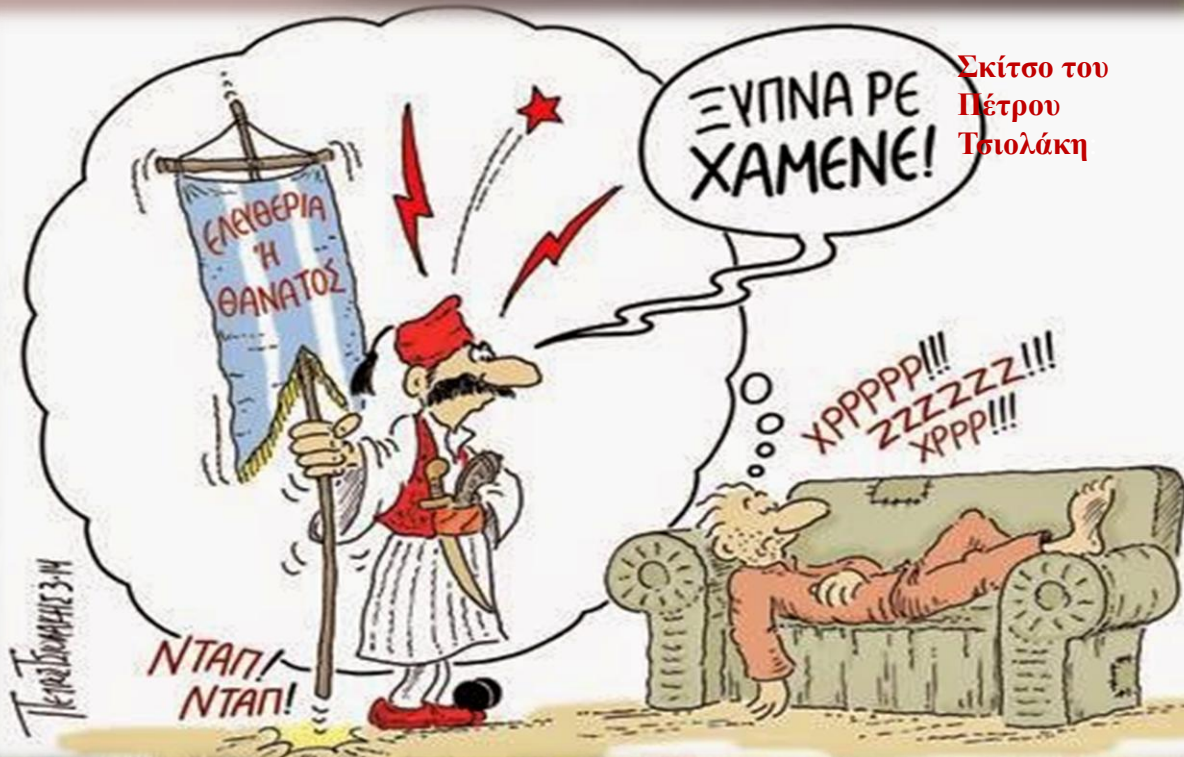
Σκίτσο του Πέτρου Τσιολάκη