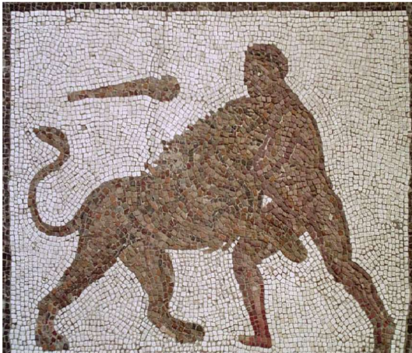
Φωτεινή και Γεωργία.

Μετά πήγε και περίμενε κοντά στη φωλιά του λιονταριού κι, όταν αυτό φάνηκε, το χτύπησε πρώτα με τα βέλη του. Τα βέλη του έπεσαν στη γη χωρίς να το τραυματίσουν και το λιοντάρι επιτέθηκε στον Ηρακλή. Εκείνος το χτύπησε με το ρόπαλο. Το λιοντάρι πόνεσε και κρύφτηκε στη φωλιά του. Ο Ηρακλής τότε μάζεψε μεγάλες πέτρες, έκλεισε την μια είσοδο και μπήκε από την άλλη. Το ζώο βρυχήθηκε και σείστηκε όλο το βουνό. Όρμησε πάνω στον ήρωα και πάλευαν μια ώρα. Τέλος ο Ηρακλής τύλιξε τα χέρια του γύρω από το λαιμό του και το έπνιξε. Μετά πήρε το δέρμα του, τη λεοντή , το φόρεσε και γύρισε στις Μυκήνες. Όταν τον είδε ο Ευρυσθέας τρόμαξε πολύ και διέταξε να του φτιάξουν ένα χάλκινο πιθάρι, για να κρύβεται όταν θα κινδύνευε.