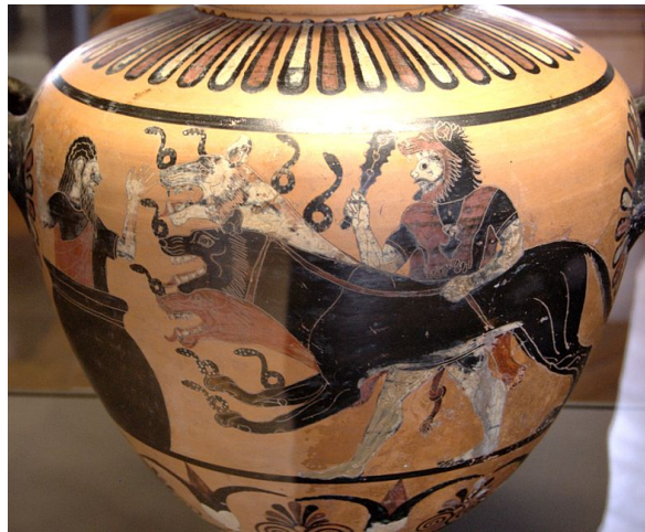
ΓΕΩΡΓΙΟΣ Κ. ΤΑΞΗΤ'2

Στη γη ο Ηρακλής ήταν ανίκητος. Γι' αυτό ο Ευρυσθέας αποφάσισε να τον στείλει να στον Κάτω Κόσμο για να του φέρει τον Κέρβερο , ένα φοβερό σκυλί με τρία κεφάλια, που φύλαγε την είσοδο του Άδη. Ο Ηρακλής πήγε στον Άδη και, με την άδεια του Πλούτωνα και της Περσεφόνης, πάλεψε με τον Κέρβερο, τον νίκησε, τον έδεσε και τον έφερε στις Μυκήνες.