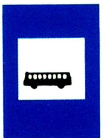
Στάση λεωφορείου ή τρόλεϊ