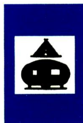
Θέσεις για κατασκηνώσεις και τροχόσπιτα