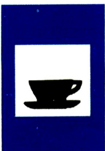
Αναψυκτήριο ή καφενείο