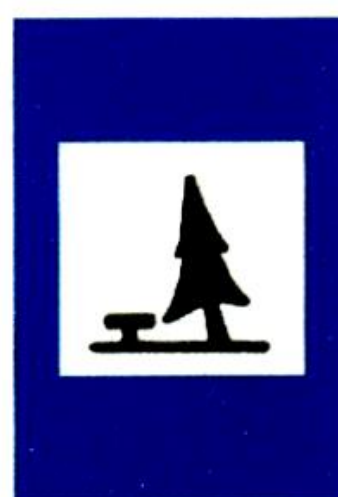
Θέση για παραμονή εκδρομέων