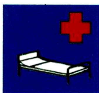
Νοσοκομείο: αποφεύγουμε τους θορύβους