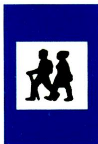
Σημείο, από όπου αρχίζει ο περίπατος