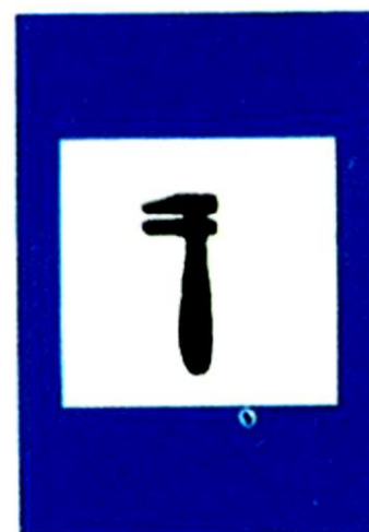
Συνεργείο επισκευής βλαβών