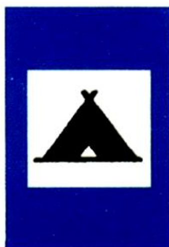
Θέση για κατασκήνωση