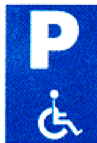
Χώρος στάθμευσης για άτομα με μειωμένη κινητικότητα