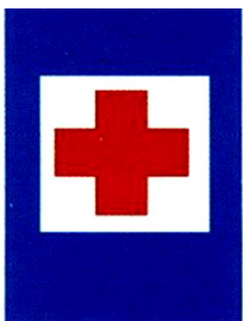
Σταθμός πρώτων βοηθειών