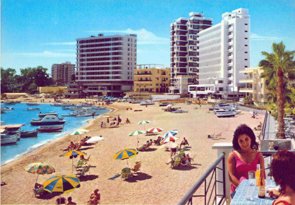
Famagusta, The Beach, Cyprus.