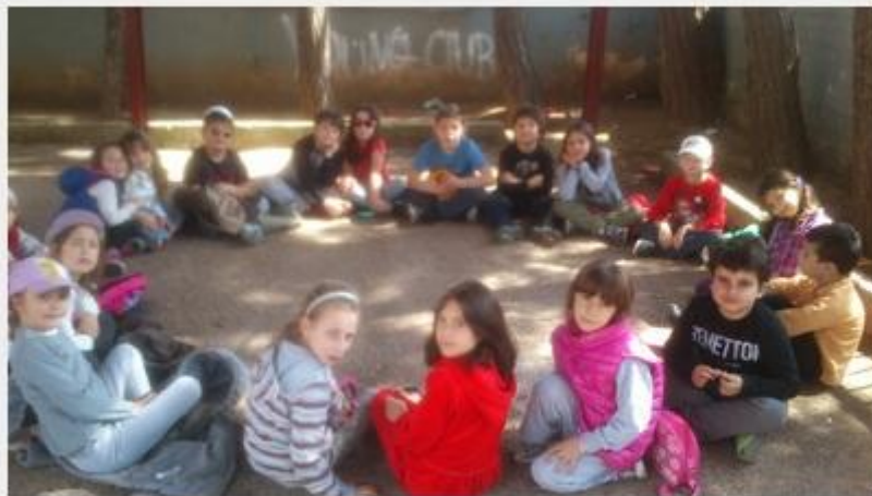
ο φιλοσοφικός κύκλος