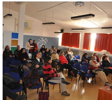
Συνάντηση της Σ.Ε. και της Π.Ο.

ε) Προώθηση και δημοσιοποίηση όλων των σχολικών δράσεων σε όλα τα μέλη του δικτύου και την ευρύτερη εκπαιδευτική κοινότητα, μέσω του ιστολογίου.