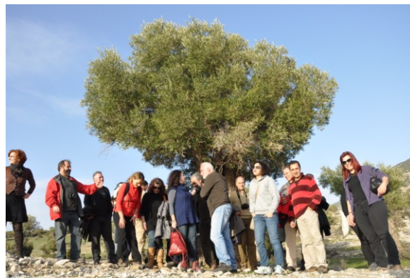
Η Σ.Ε. και η Π.Ο. στα βήματα του Οδυσσέα...

Οι εκπαιδευτικοί, ως ενεργά μέλη της εκπαιδευτικής μας κοινότητας, θα έχουν την ευκαιρία να είναι συνδημιουργοί της τελικής του μορφής του υλικού, η οποία θα προκύψει στη συνέχεια [2 ο πακέτο]. Παράλληλα, θα μπορούν να ανατροφοδοτούνται από τη δουλειά των συναδέλφων τους, να προτείνουν νέους τρόπους προσέγγισης της θεματολογίας του δικτύου, να συνεργάζονται, κατά ομάδες, με όμορες [ή μη] σχολικές μονάδες κ.ά.