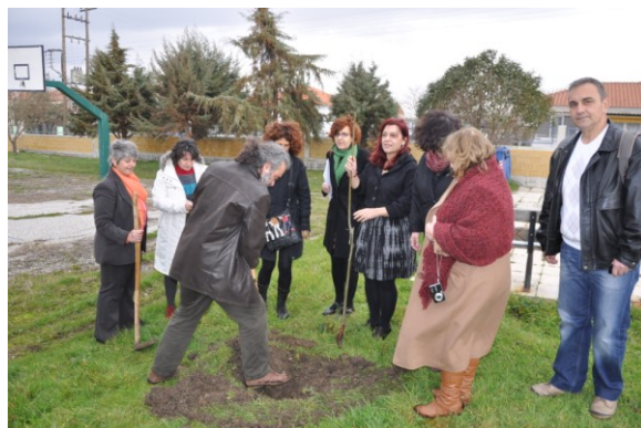
Δενδροφύτευση από την Π.Ο. του Δικτύου...

21ο Διεθνές Συνέδριο Φυσικής Αγωγής & Αθλητισμού, Κομοτηνή 17-19 Μαΐου 2013 Δημοκρίτειο Πανεπιστήμιο Θράκης, Τμήμα Επιστήμης Φυσικής Αγωγής και Αθλητισμού