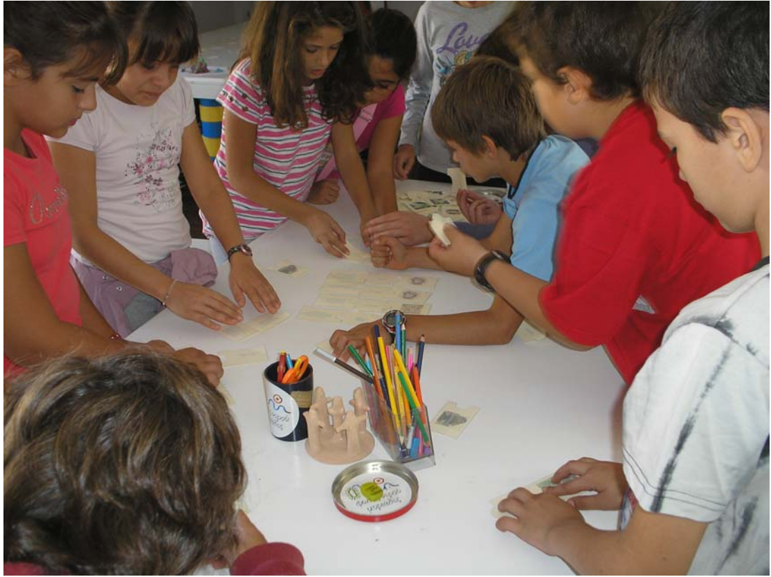
Παιχνίδι συναρμογής (άνω)