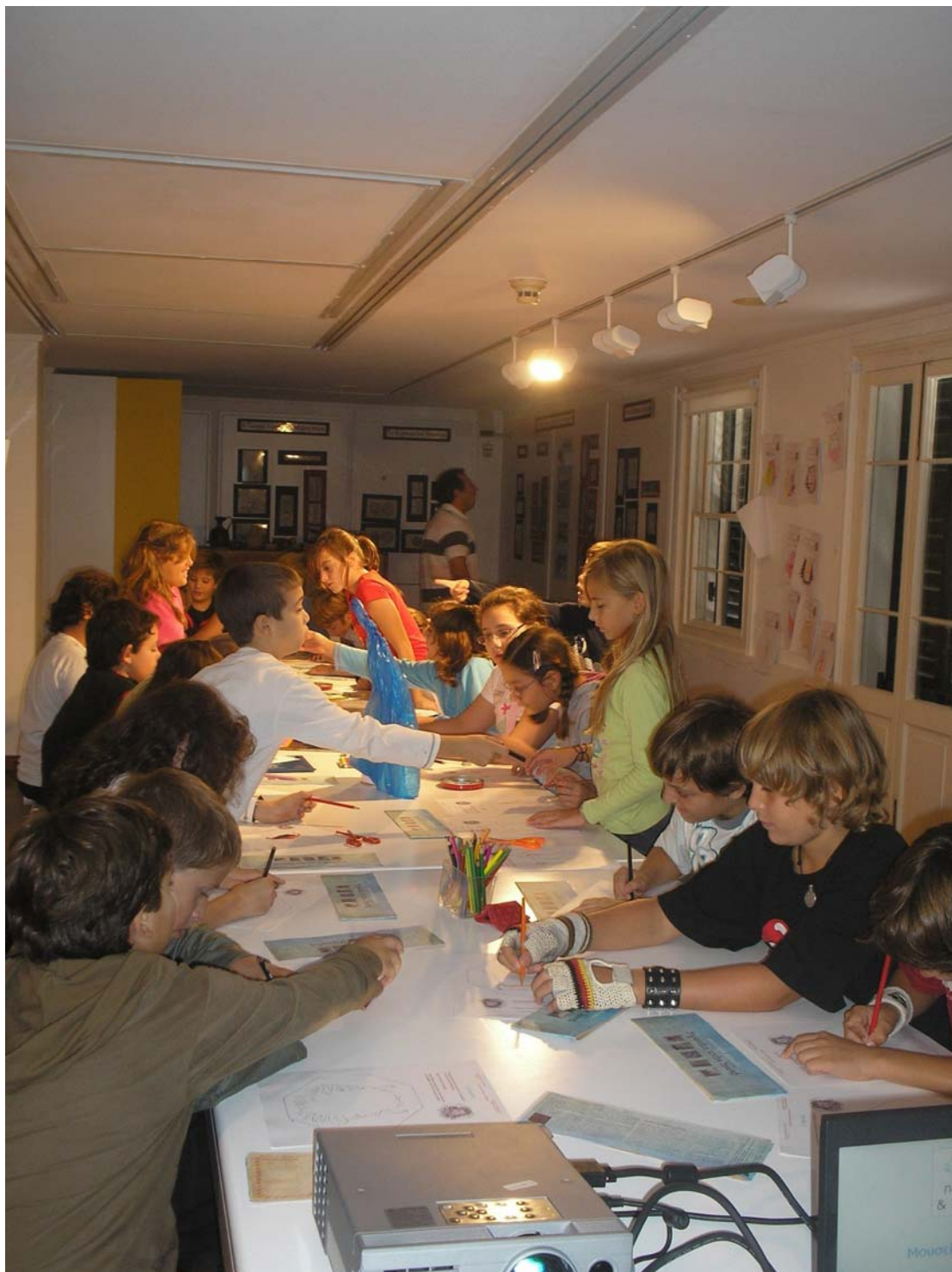
Συμπλήρωση φύλλων εργασιών