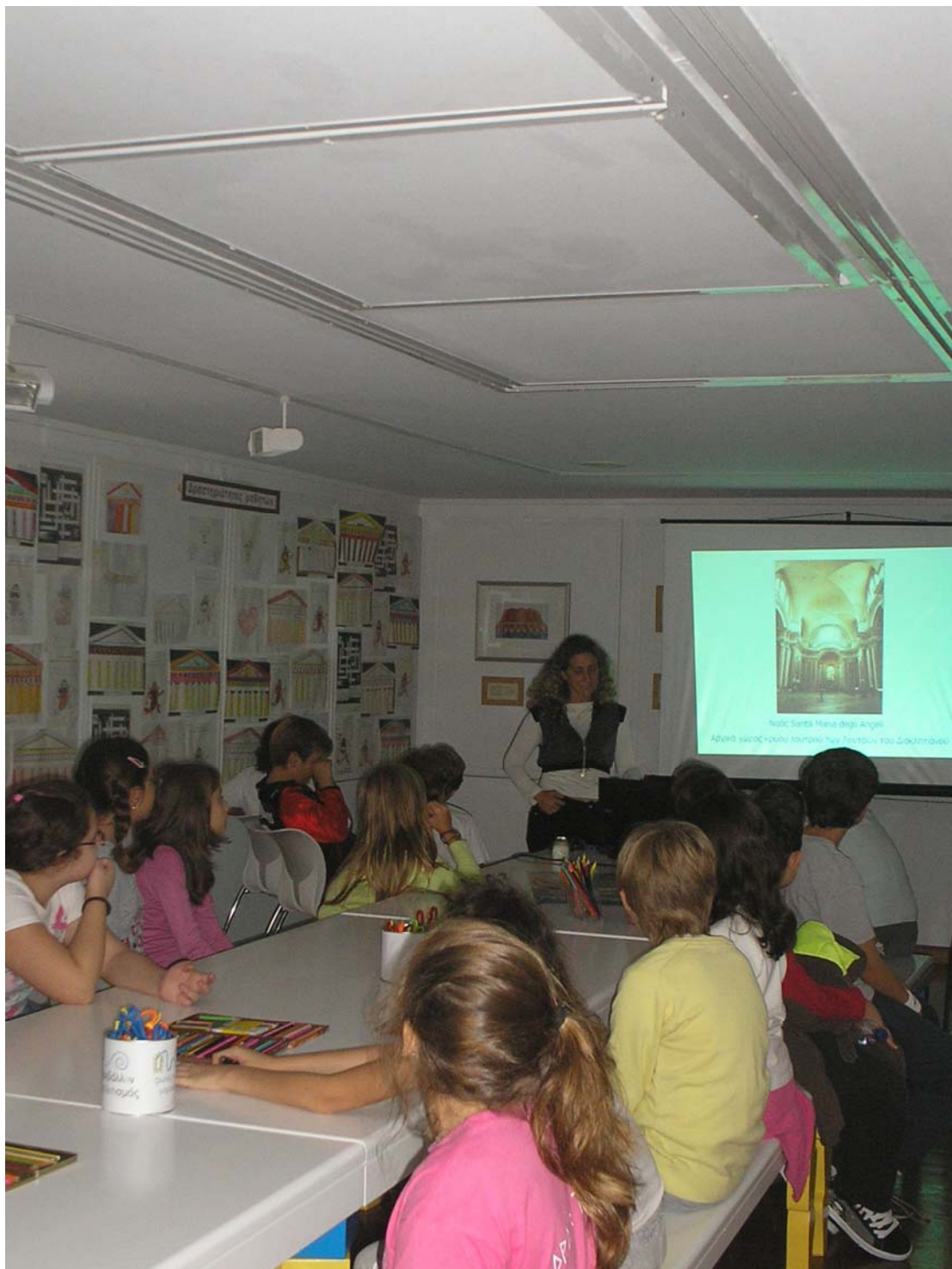
Παρουσίαση ppt σε μαθητές