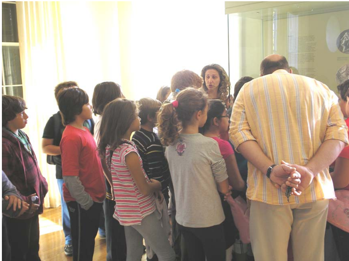
Αίθουσα: «Αγορά», ξενάγηση μαθητών (άνω)