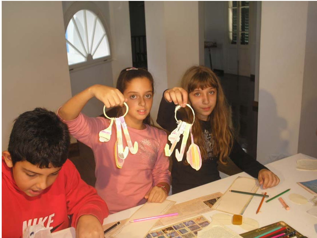
Μαθήτριες με τ' αντικείμενα απ' τη χαρτοκοπτική