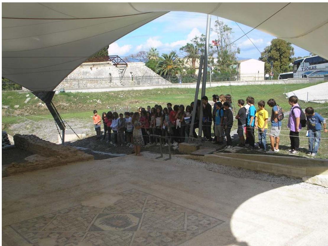
Ξεναγήση περιβαλλοντικής ομάδας, 7 ο Γυμνασίου, Κέρκυρας