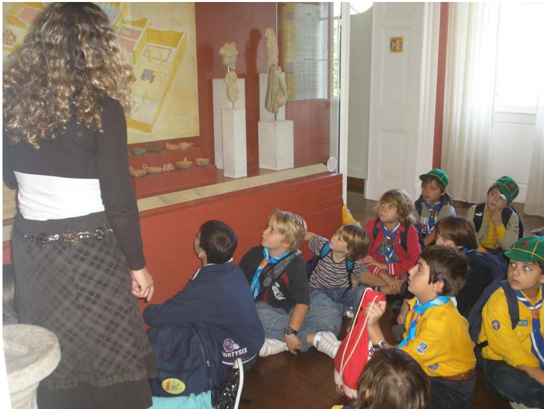
Αίθουσα λουτρών, ξενάγηση 1 ου Σύστημα Προσκόπων Κέρκυρας (άνω), Σχολείο (κάτω)