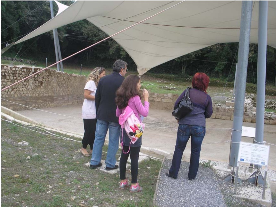
Ξεναγηση οικογένειας στα ρωμαϊκά λουτρά Παλαιόπολης.