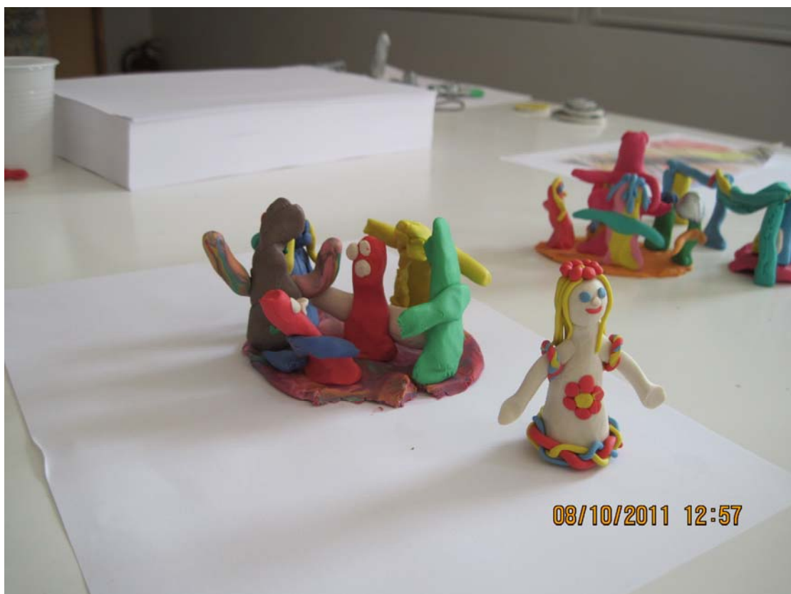
Κατασκευές μαθητών (κάτω)