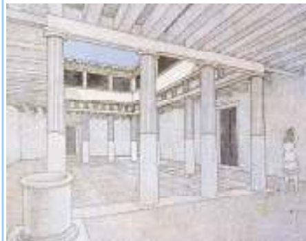
αναπαράσταση του αίθριου της Οικίας των Κωμωδών

Στο βραχώδες νησί δεν υπάρχουν πηγαία νερά, αλλά στο στεγανό γρανιτικό υπόβαθρο, παρά την έντονη τεκτονική διάρρηξη που επικρατεί στο χώρο, δημιουργείται ένας περιορισμένος, αλλά σημαντικός για το νησί φρεατικός ορίζοντας σε μικρό σχετικά βάθος. Το πόσιμο νερό αντλείται από την αρχαιότητα μέχρι σήμερα από τα ίδια πηγάδια (πηγάδι της Κλεοπάτρας, πηγάδι του Μαλτέζου) που βρίσκονται στα αίθρια των αρχαίων σπιτιών. Όλα τα σπίτια είχαν κάτω από το αίθριο, την κεντρική υπαίθρια αυλή, μια μεγάλη τετράγωνη δεξαμενή στην οποία συγκεντρωνόταν το βρόχινο νερό από την στέγη. Η οροφή της δεξαμενής στηρίζεται σε τόξα από πωρόλιθο και καλύπτεται με ψηφιδωτό δάπεδο που είναι χαμηλότερα από το δάπεδο του περισώου (=ο στεγασμένος χώρος γύρω από το αίθριο). Πιθανόν ο χώρος αυτός γειμίζονταν τους καλοκαιρινούς μήνες με νερό, που αφενός μεν αναδείκνυε τα χρώματα του ψηφιδωτού, αφετέρου, με την εξάτμιση, δημιουργούσε μια αίσθηση δροσιάς γύρω. Εκτός από τα ιδιωτικά πηγάδια των σπιτιών, υπήρχαν πολλά δημόσια πηγάδια και κρήνες.