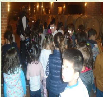
Εορτασμός 28ης Οκτωβρίου