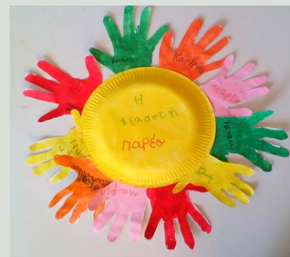
«Η γελαστή παρέα»

Όταν καθίσαμε πρώτη φορά στο μαγικό κύκλο δώσαμε ένα όνομα στην ομάδα μας και φτιάξαμε το σύμβολό της.