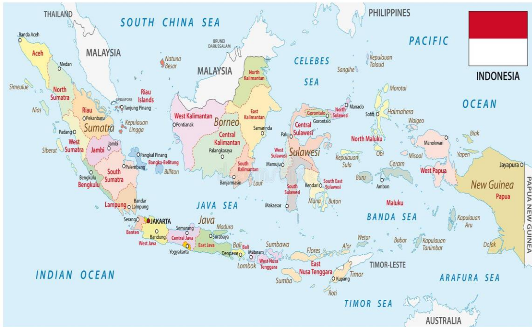
«Πολιτικός χάρτης της Ινδονησίας»