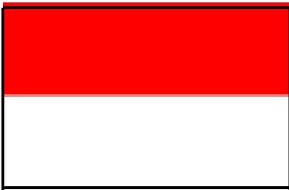
«Η σημαία της Ινδονησίας»

Οι παραλίες μπορεί να είναι το πρώτο πράγμα που έρχεται στο μυαλό όταν σκέφτεστε το Μπαλί, αλλά τα πράσινα πεδία του ρυζιού είναι πολύ κοντά. Τόσο πλούσια όσο και ζωντανή είναι οι ταράτσες των πεδίων ρυζιού Jatiluwih που χαρακτηρίστηκαν ως Πολιτιστικό Τοπίο της UNESCO ως τμήμα του Subak System του Μπαλί. Τα σχολαστικά καλλιεργημένα και αρδευόμενα χωράφια αποδεικνύουν τον πλούτο των φυσικών πόρων στο Μπαλί, καθώς και τις προσεγμένες δεξιότητες των τοπικών αγροτών.