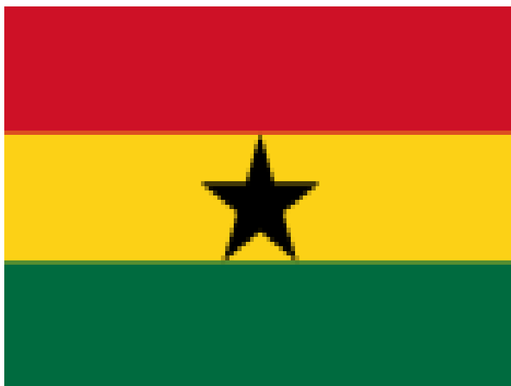
«Η σημαία της Γκάνας»

Το σιδηροδρομικό δίκτυο καλύπτει γύρω στα 950 χλμ και η χώρα διαθέτει 10 αεροδρόμια.