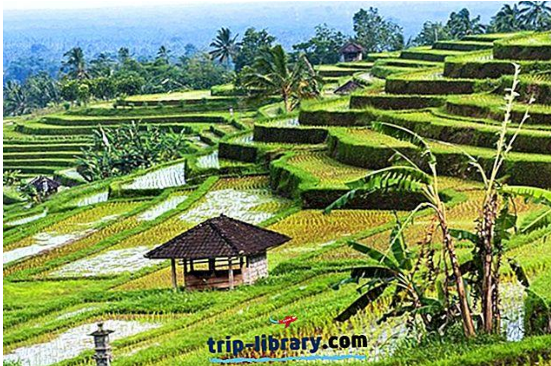
Jatiluwih Rice Fields

Οι παραλίες μπορεί να είναι το πρώτο πράγμα που έρχεται στο μυαλό όταν σκέφτεστε το Μπαλί, αλλά τα πράσινα πεδία του ρυζιού είναι πολύ κοντά. Τόσο πλούσια όσο και ζωντανή είναι οι ταράτσες των πεδίων ρυζιού Jatiluwih που χαρακτηρίστηκαν ως Πολιτιστικό Τοπίο της UNESCO ως τμήμα του Subak System του Μπαλί. Τα σχολαστικά καλλιεργημένα και αρδευόμενα χωράφια αποδεικνύουν τον πλούτο των φυσικών πόρων στο Μπαλί, καθώς και τις προσεγμένες δεξιότητες των τοπικών αγροτών.