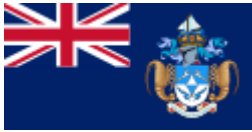
ΣΗΜΑΙΑ ΤΗΣ ΧΩΡΑΣ