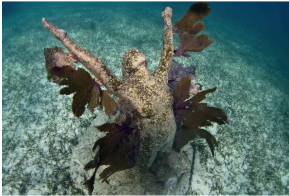
Το υποβρύχιο μουσείο του Cancun