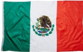
Η σημαία του Μεξικού

Μερικές απ' τις ενδιαφέροντες πληροφορίες του Μεξικού είναι το υποβρύχιο μουσείο του Cancun, η ανακάλυψη εξωγήινων μουμιών στη Νάζκα του Περού και η πανάρχαια πόλη του Μάτσου Πίτσου που αποτελεί ένα από τα νέα 7 θαύματα του κόσμου.