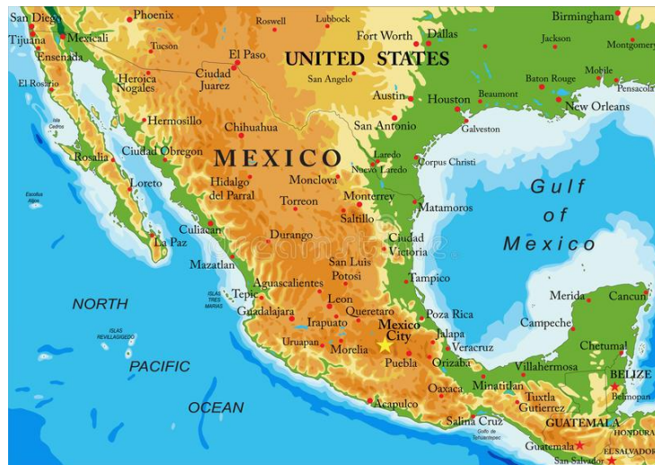
Ο χάρτης του Μεξικού