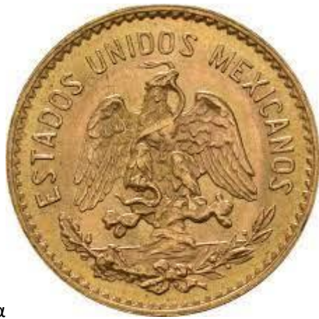
Το Μεξικάνικο νόμισμα