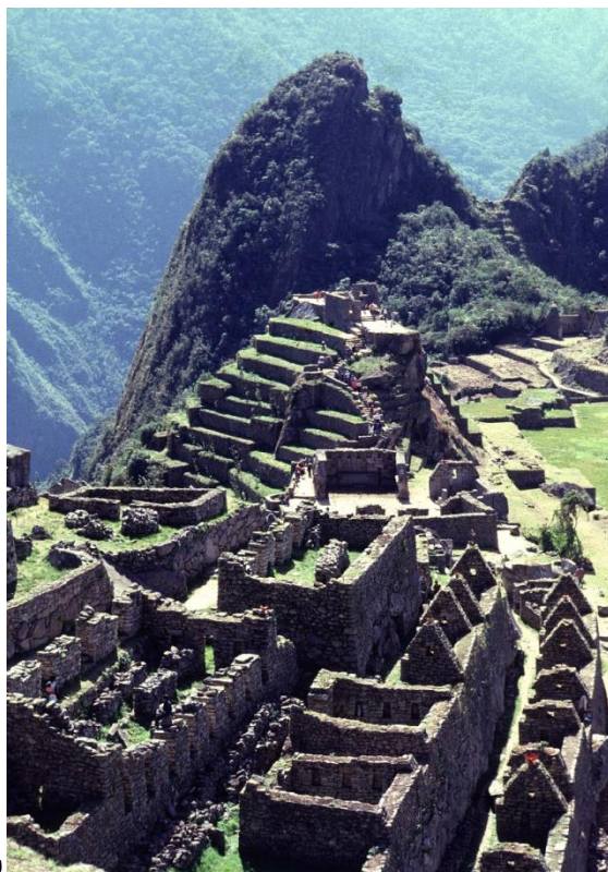
Η αρχαία πόλη του Μάτσου Πίτσου