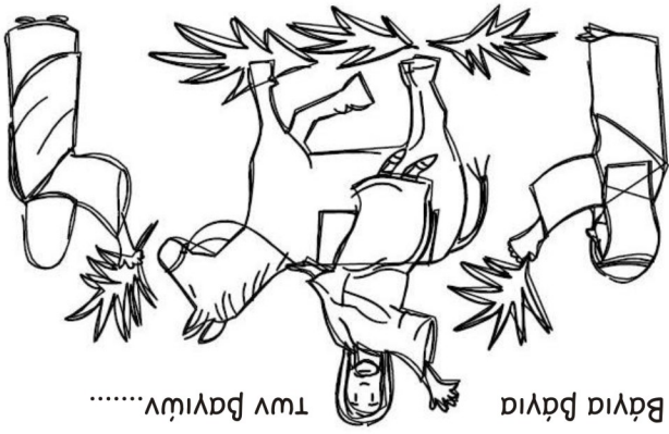
Βαγία Βαγία των Βαγιών.....

Ήμουνα στη γη, στη γη βαθιά Χωμζένος, κι από τους εχθρούς, εχθρούς βαλάντωμζένος.