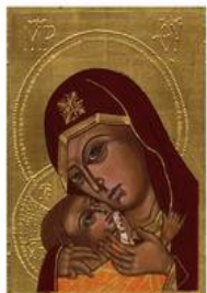
ΜΗΤΡΟΤΗΤΑ ΚΑΙ ΘΡΗΣΚΥΙΑ

Πίνακες ζωγραφικής που αναπαριστούν προσωπικές στιγμές μητέρων- παιδιών.