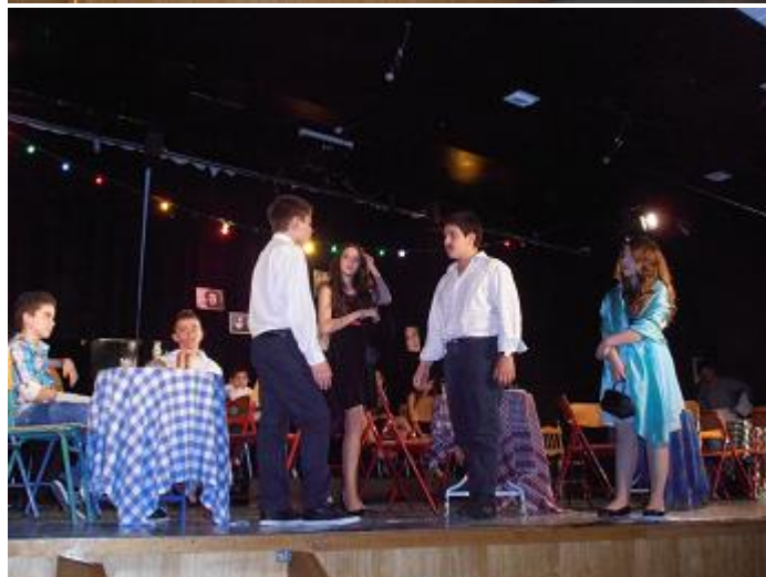
Στιγμιότυπο από την παράσταση των μαθητών της Έκτης Τάξης του 9ου Δημοτικού Σχολείου Αλίμου .