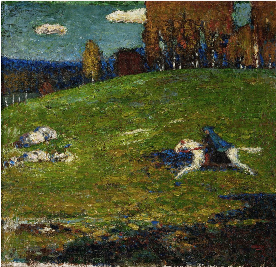
The Blue Rider (Der Blaue Reiter), 1903

Στο να ακολουθήσει καριέρα καλλιτεχνική , συνετέλεσαν κυρίως δύο γεγονότα : η έκθεση των Γάλλων ιμπρεσιονιστών στη Μόσχα και η παρουσίαση του έργου Λόεγκριν του Ρίχαρντ Βάγκνερ στο Βασιλικό Θέατρο της Μόσχας . Όμως ο Καντίνσκι δεν παρέλειπε να λέει πως «ο πατέρας μου, μου επέτρεπε με ασυνήθιστη υπομονή , να ακολουθήσω τα όνειρα μου και να κάνω το κέφι μου σε όλη μου τη ζωή. Οι γραμμές αυτές θα πρέπει να είναι οδηγός για όσους γονείς προσπαθούν να αποτρέψουν , και συχνά με τη βία , τα παιδιά τους -και κυρίως τα προικισμένα - από τις αληθινές τους κλίσεις κάνοντας τα δυστυχημένα ».