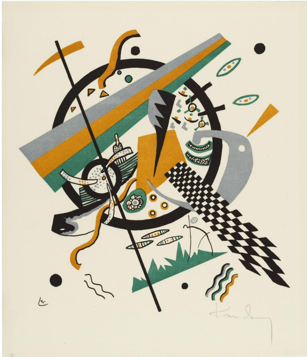
Small Worlds IV (Kleine Welten IV), MoMA

Στο Μόναχο ο Καντίνσκι βρίσκει χώρο για να κάνει τη δική του καλλιτεχνική δήλωση για το πώς έβλεπε τη ζωή και τον κόσμο και να δημιουργήσει τη δική του παρτιτούρα παίζοντας με τα χρώματα και τις φόρμες σαν νότες μουσικής, με εκείνον ως συνθέτη να αναζητά μέσα από την ποικιλομορφία της παρτιτούρας να αποδώσει τις αντιθέσεις, τη συνύπαρξη, εντάσεις ή αρμονία. Στο Μόναχο συναντά τους καλλιτέχνες της Απόσχισης στην ομάδα Sezession , η οποία συσπείρωνε καλλιτέχνες που ακολουθούσαν διαφορετικές τεχνοτροπίες. Αποτυγχάνει στις εξετάσεις του στην Ακαδημία του Μονάχου , αλλά παρακολουθεί μαζί με τον Πάουλ Κλέε τα μαθήματα του σπουδαίου δασκάλου Φραντς φον Στουκ .