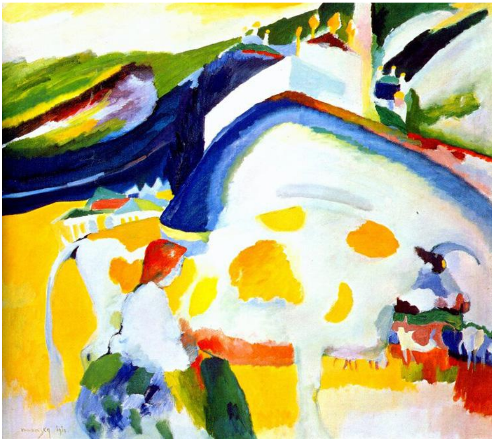
The Cow, 1910

Στις 18 Δεκεμβρίου 1911 οργανώθηκε η πρώτη έκθεση της ομάδας του Γαλάζιου Καβαλάρη με συμμετοχή του Καντίνσκι, του Μαρκ, του Αουγκούστ Μάκε, του Ρομπέρ Ντελωναί και άλλων, ενώ δημοσιεύθηκε η πραγματεία του « Για το Πνευματικό στην Τέχνη ». Στα μάτια του όλες οι τέχνες προσέγγιζαν το αφηρημένο , ενώ οι αντιλήψεις του για το χρώμα και τη δομή θα οδηγούσαν σε μία « καθαρή ζωγραφική », μία ανάμειξη χρώματος και φόρμας όπου το καθένα υπάρχει ξεχωριστά αλλά και μαζί , σε μία κοινή ζωή που ονομάζεται εικόνα και προκύπτει ως εσωτερική αναγκαιότητα. Ο « Γαλάζιος Καβαλάρης » όπως ονειρευόταν ο Καντίνσκι ήταν ένα κίνημα-έκκληση για μία πνευματική αναγέννηση σε όλες τις μορφές τέχνης.