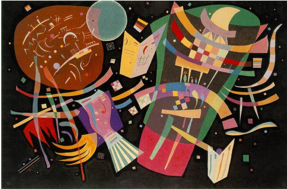
Composition 10, 1939

Μετά την εκστρατεία των Ναζί εναντίον του Μπαουχάους και το κλείσιμο της σχολής, ο Καντίνσκι εγκαταστάθηκε στο Παρίσι, στο προάστιο Νείγύ-συρ-Σεν. Εκεί συνδέεται με τους παλιούς του φίλους όπως ο Ντελονέ, ενώ θαυμάζει τα έργα των Χουάν Μιρό, Ζαν Αρπ και του Αλμπέρτο Μανιέλι. Εκεί ζει και εργάζεται απομονωμένος, προχωρώντας σε νέες διαφοροποιήσεις της εικαστικής του έκφρασης αλλά και μία σύνθεση των παλαιότερων ιδεών του. Στα έργα του ακόμα, κυριαρχούν τα λεγόμενα «βιομορφικά» σχήματα, έχοντας ως πηγή έμπνευσης εγκυκλοπαίδειες και εργασίες βιολογίας, όπως τα έργα του Ερνστ Χέκελ (Kunstformen der Natur) ή του Καρλ Μπλόσφελντ (Unformen der Natur).