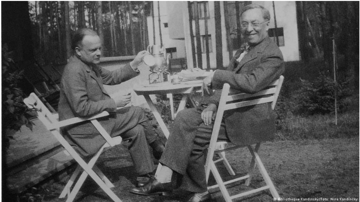
Πάουλ Κλέε (αριστερά) και Βασίλι Καντίνσκι, δυο παντοτινοί φίλοι

το 1904, παρουσίασε συνολικά δώδεκα εκθέσεις , μέσα από τις οποίες αναδείχθηκε το έργο συμβολιστών, μετα-ιμπρεσιονιστών και καλλιτεχνών της Αρ Νουβό .