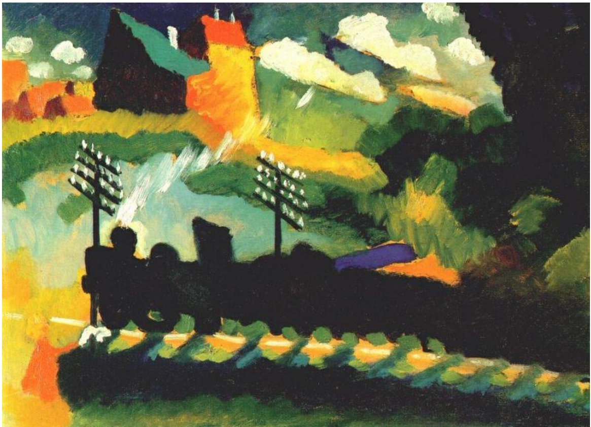
Murnau train et château, 1909