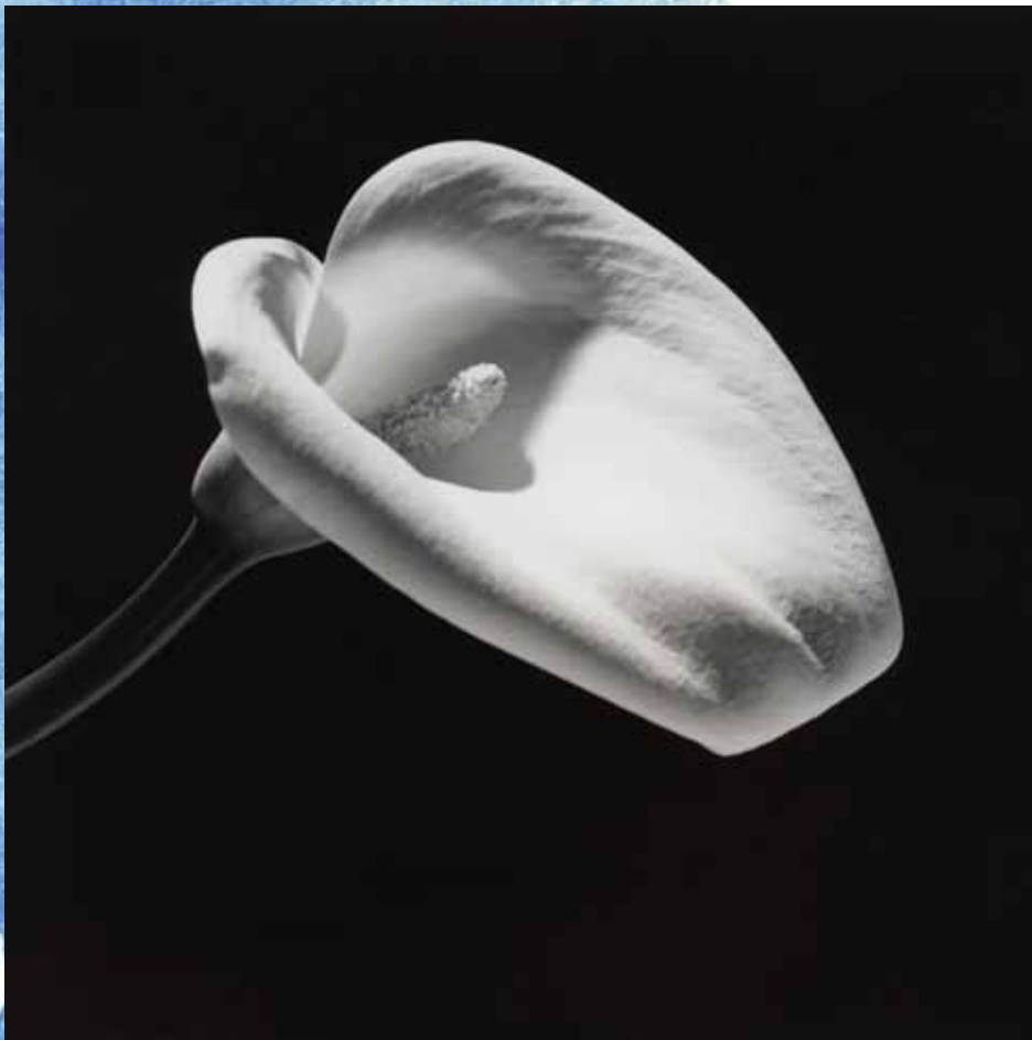
Robert Mapplethorpe Calla Lily , 1984