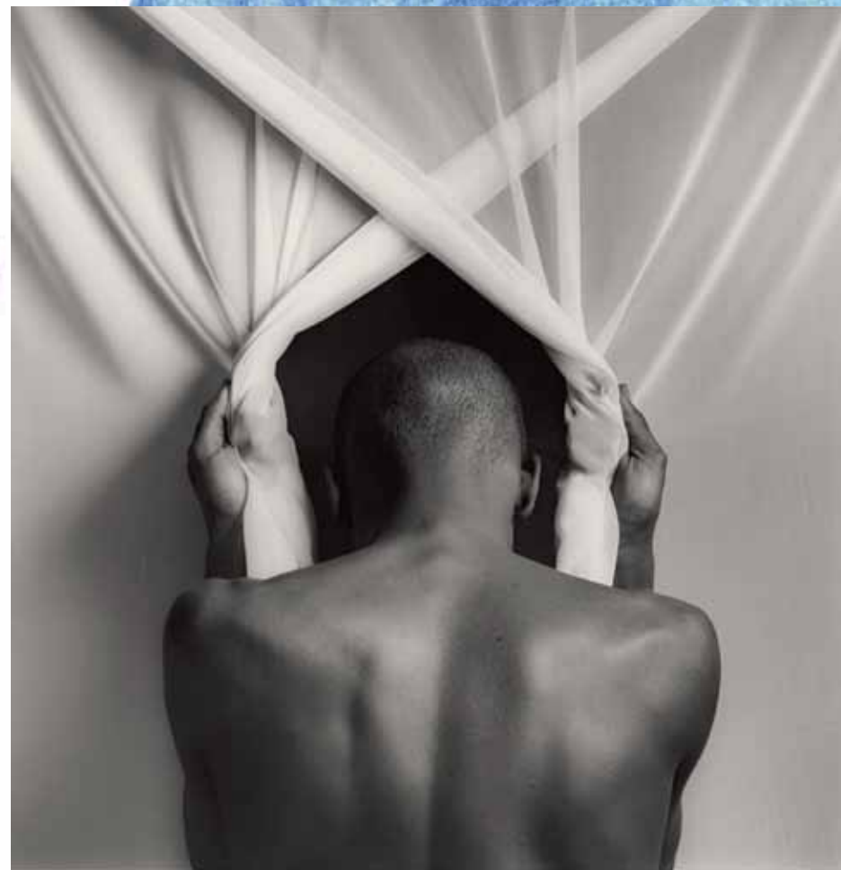
Robert Mapplethorpe Phillip Prioleau, 1982

Εκπαιδευτικό πρόγραμμα θα πραγματοποιηθεί και στο πλαίσιο της Έκθεσης Πρόσωπα , η οποία λαμβάνει ως αφετηρία της την ταινία Faces του Τζων Κασσαβέτη (1968) για να πραγματευτεί την έννοια του προσώπου (πρόσωπο, προσωπίο, εκμαγείο). Οι δεκατέσσερις καλλιτέχνες που θα συμμετάσχουν στην έκθεση προέρχονται από διαφορετικές χώρες και εποχές και δημιουργούν με διαφορετικά μέσα. Το εκπαιδευτικό πρόγραμμα θα λάβει χώρα από το Μάρτιο έως τα τέλη Μαΐου 2012, κάθε Δευτέρα και Τρίτη πρωί. Για περισσότερες πληροφορίες και κρατήσεις επικοινωνήστε με το Τμήμα Εκπαιδευτικών Προγραμμάτων της Στέγης.