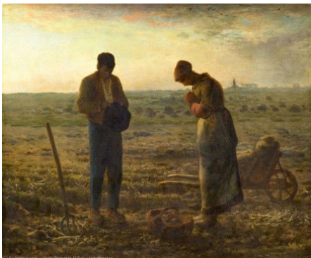
El Ángelus, Εσπερινός (1857), Μουσείο Ορσέ, Παρίσι.