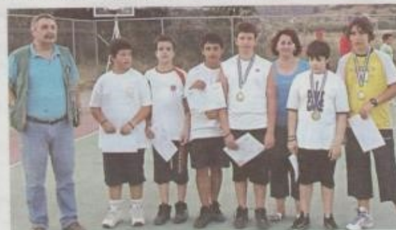
Παράγοντες του Αστέρα Αλιβερίου με τους νικητές από τις μικρές κατηγορίες αγοριών.