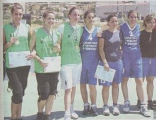
Οι φιναλίστ του τελικού κοριτσιών στις μεγαλύτερες ηλικίες.