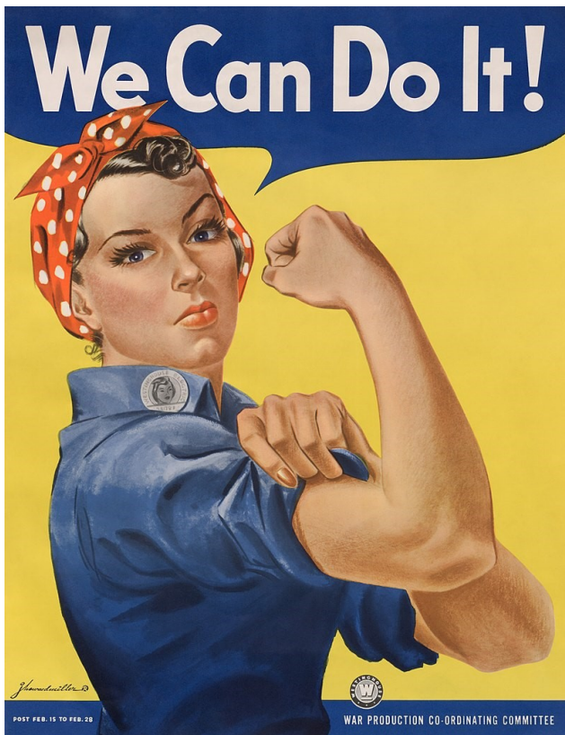
Η «Ρόζι που καρφώνει»