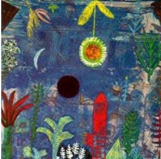
Paul Klee: Βυθισμένο τοπίο-sunken landscape

Ένας πίνακας μπορεί να είναι κι ένα όνειρο; Εσύ ζωγραφίζεις τα όνειρά σου;