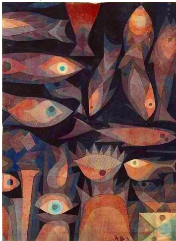
Πάουλ Κλέε, Ψάρια Το ένα μάτι βλέπει, το άλλο νοιώθει.

Ένα νυχτολούλουδο με τις ρίζες του στον ουρανό, σαν το πουλί που περπατάει ανάποδα. Το μισοφέγγαρο κι ένας μαύρος ήλιος στο κέντρο. Ένα όνειρο κρυμμένο μέσα στο σκοτάδι, που μπορείς να δεις και ανάποδα.