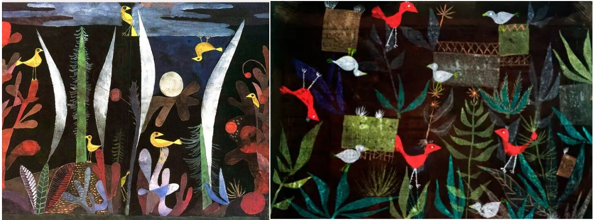
Paul Klee: Τοπίο με κίτρινα πουλιά-Landscape with Yellow Birds Paul Klee: Bird garden

Τρεις πίνακες του ονείρου. Μπορείς να βρεις σε τι μοιάζουν;