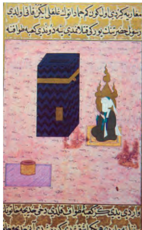
Ο Μωάμεθ μπροστά στην Κάαμπα, μινιατούρα

αποσύρεται σε ερημικούς τόπους και να στοχάζεται πάνω στα προβλήματα της ζωής, της κοινωνίας, της αδικίας κ.ά. Σε έναν τέτοιο τόπο, στον λόφο Χίρα, και σε ηλικία 40 ετών ο Μωάμεθ βίωσε μια βαθιά πνευματική εμπειρία, την οποία αισθάνθηκε ως κλήση από τον Θεό. Οραματίστηκε, δηλαδή, μια μορφή –αργότερα ο ίδιος την ταύτισε με τον αρχάγγελο Γαβριήλ– που τον διαβεβαίωσε ότι είναι ο απεσταλμένος του Θεού.