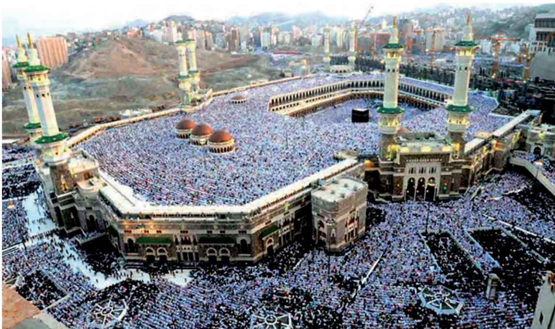
Μάστζιτ αλ-Χαράμ (Το μεγάλο Τέμενος) στη Μέκκα