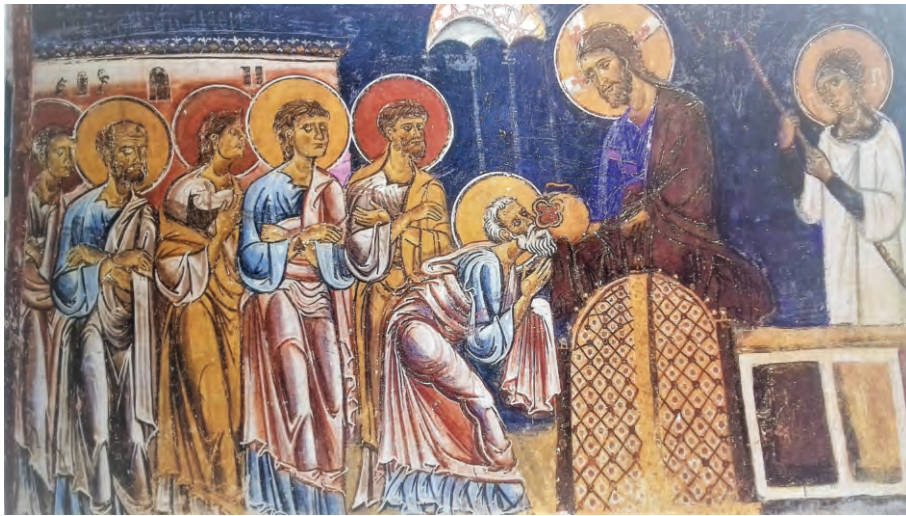
Η Μετάδοση των Αποστόλων: Τράπεζα Ι. Μ. Πάτμου (στο Αθ. Κομίνη (επ.), Οι θησαυροί της Μονής Πάτμου , Εκδοτική Αθηνών 1988, σ. 93)

Σχολικό Βιβλίο Θρησκευτικῶν Α' Λυκείου, Διδ. Εν. 15