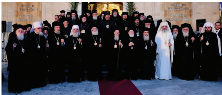
Προκαθήμενοι Ορθοδόξων Εκκλησιῶν κατά την παραμονή της Αγίας και Μεγάλης Συνόδου, Ἄγ. Τίτος Ηρακλείου, Κρήτη, 2016