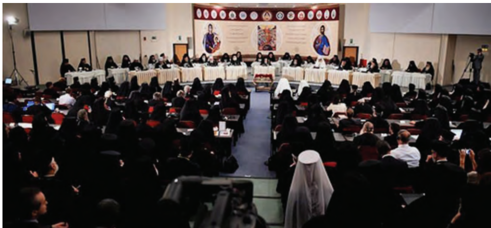
Εναρκτήρια συνεδρία της Αγίας και Μεγάλης Συνόδου, Κρήτη, 2016

Μήνυμα της Αγίας και Μεγάλης Συνόδου της Ορθοδόξου Εκκλησίας, Κρήτη, 2016