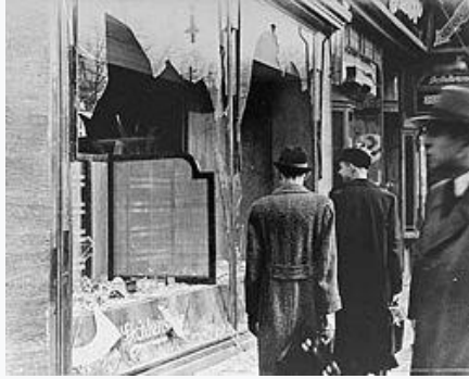
Ένα δείγμα από τα απομεινάρια της «Νύχτας των Κρυστάλλων»