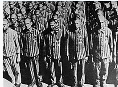
Ολλανδοί Εβραίοι στο Μπούχενβαλντ