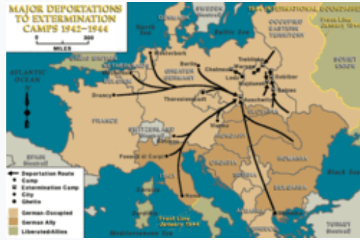
Οι μεγαλύτερες απελάσεις κρατουμένων προς στρατόπεδα εξόντωσης στην Ευρώπη