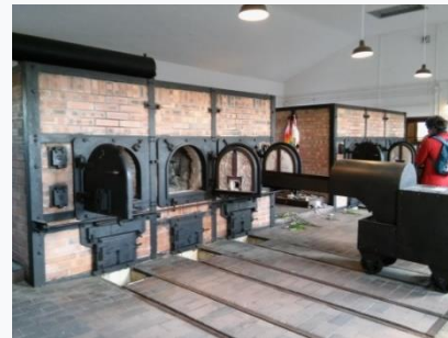
Κρεματόριο στο Μπούχενβαλντ