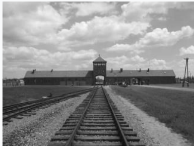
Στρατόπεδο συγκέντρωσης Αουσβιτς