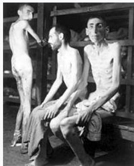
«Σκλάβοι» που υποβάλλονταν σε καταναγκαστική εργασία στο Μπούχενβαλντ