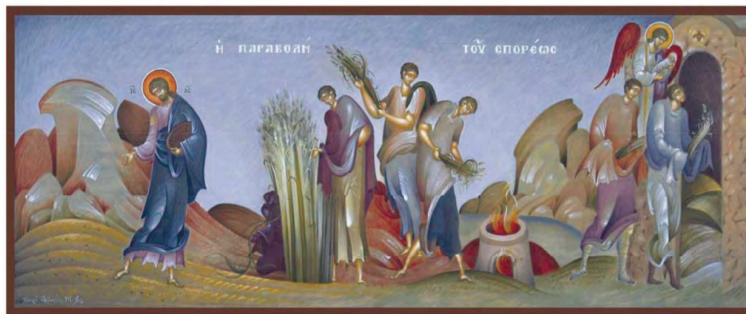
Η Παραβολή του Σποριώς. Εικόνα διά χειρός Φίκου, 2006. Αυγοτέμπερα σε χειροποίητο ιαπωνικό χαρτί κολλημένο σε ξύλο.

1Άρχισε πάλι να διδάσκει ο Ιησούς πλάι στη λίμνη της Γαλιλαίας. Γύρω του είχε μαζευτεί πάρα πολύς κόσμος· γι' αυτό ο ίδιος μπήκε και κάθισε σ' ένα πλοιάριο, ενώ όλος ο κόσμος έμεινε στη στεριά δίπλα στη λίμνη. 2Τους δίδασκε πολλά με παραβολές και τους έλεγε: 3«Προσέξτε. Βγήκε ο σποριάς να σπείρει. 4Και καθώς έσπερνε, μερικοί σπόροι έπεσαν στο δρόμο, κι ήρθαν τα πουλιά και τους έφαγαν. 5Άλλοι έπεσαν σε πετρώδες έδαφος που δεν είχε πολύ χώμα κι αμέσως φύτρωσαν, γιατί το χώμα ήταν λιγιστό. 6Μόλις όμως ανέτειλε ο ήλιος, κάηκαν, κι επειδή δεν είχαν ρίζες ξεράθηκαν. 7Άλλοι σπόροι έπεσαν στ' αγκάθια, κι όταν τ' αγκάθια μεγάλωσαν τους έπνιξαν και δεν καρποφόρησαν. 8Τέλος άλλοι έπεσαν στο γόνιμο έδαφος, όπου βλάστησαν, αυξήθηκαν κι έδωσαν καρπό, τριάντα κι εξήντα κι εκατό φορές περισσότερο. 9Όποιος έχει αυτιά για ν' ακούει, ας τ' ακούει αυτά», τους έλεγε.