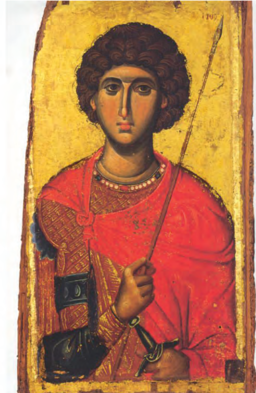
Άγιος Γεώργιος (Ι. Μ. Βατοπαιδίου, 14 ος αι.)