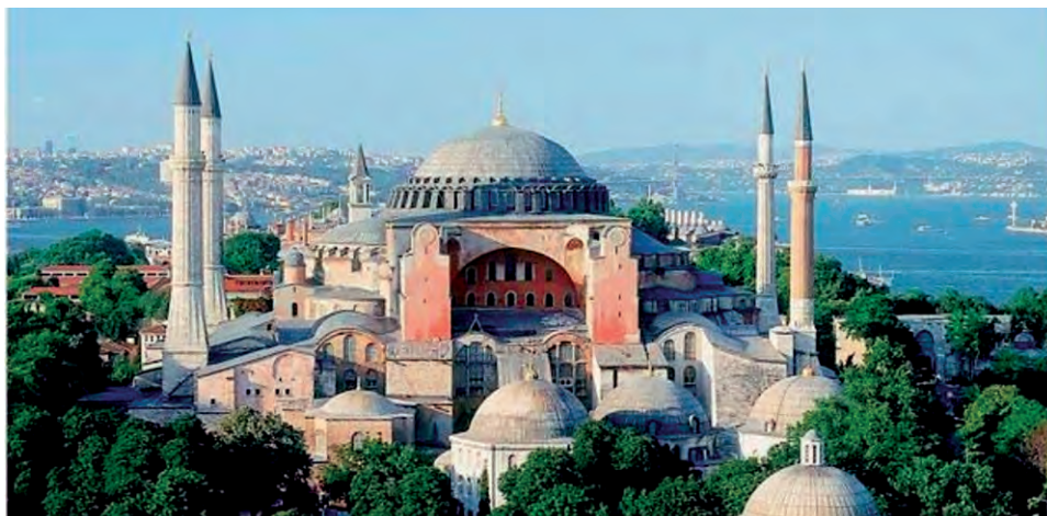
Ναοί στο σχήμα τ' ουρανού (Οδυσσέας Ελύτης)

Κάθε αρχιτεκτονικό έργο εκφράζει με τη μορφή του τις ανάγκες των ανθρώπων που το δημιουργούν. Ο αρχαιοελληνικός ναός δημιουργήθηκε για να στεγάζει το άγαλμα του θεού και να προστατεύει το θησαυρό της πόλης. Στο εσωτερικό του έμπαιναν μόνον οι ιερείς και όσοι πρόσφεραν δώρα και αναίμακτες θυσίες στο άγαλμα του θεού, ενώ το πλήθος των προσκυνητών έμενε απ' έξω, γύρω από το βωμό για τις αιματηρές θυσίες. Από εκεί έβλεπε μέσα από την ανοιχτή θύρα το πελώριο άγαλμα του θεού. Ο χριστιανικός ναός διαφοροποιήθηκε γιατί είναι «εκκλησία», δηλαδή το κτίριο και συνάμα η σύναξη των πιστών, οι οποίοι δεν παρακολουθούν από έξω σαν θεατές, αλλά συμμετέχουν στο τελούμενο μυστήριο της Θείας Ευχαριστίας. Η έμφαση λοιπόν της καλλιτεχνικής διαμόρφωσης δόθηκε στον εσωτερικό χώρο, ο οποίος δεν είναι απλά το μαρμαροχτισμένο μέγαρο, η κατοικία ενός θεού, αλλά η μικρογραφία του Σύμπαντος, γιατί εδώ γίνεται η συνάντηση του ενός και μοναδικού Θεού με τον άνθρωπο.