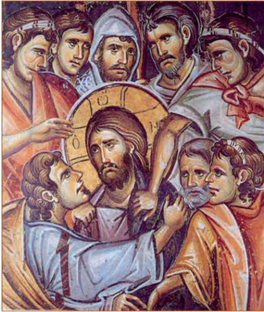
Η προδοσία (λεπτομέρεια, Ι. Μ. Βατοπαιδίου, 14 ος αι.)