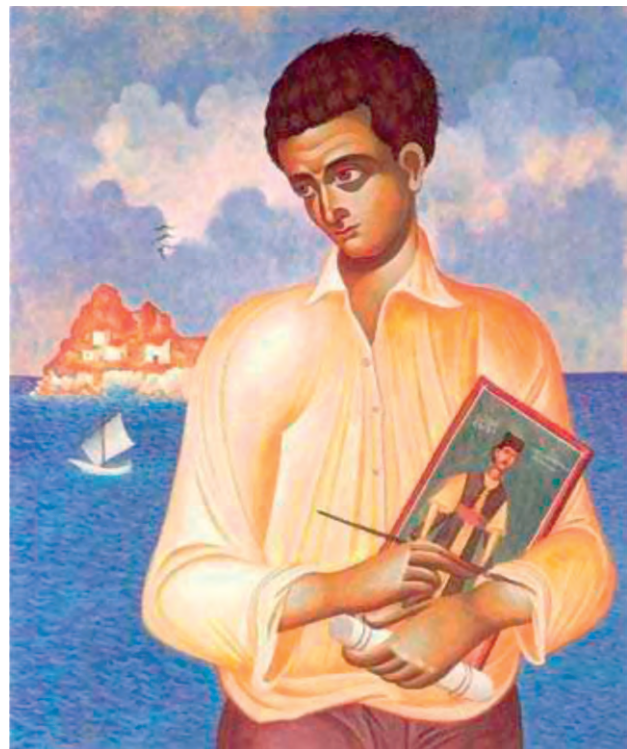
Φώτης Κόντογλου (Γεώργιος Κόρδης)