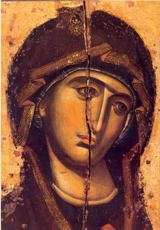
Παναγία Βρεφοκρατούσα (λεπτομέρεια, Ι. Μ. Βατοπαιδίου, 14 ος αι.)

Μαρίζα Ντεκάστρο, Βυζαντινή Τέχνη. Οδηγός για παιδιά .