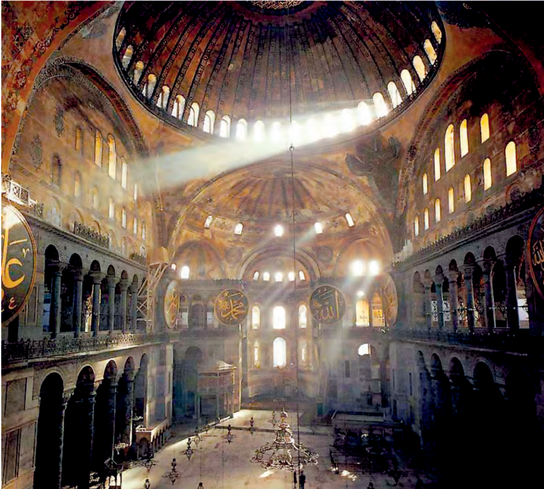
Ο Ναός της Αγίας Σοφίας στην Κωνσταντινούπολη

Μπαίνοντας στην Αγία Σοφία, βλέπουμε να χύνεται στο κέντρο του ναού το φως που τα εκατό περίπου παράθυρά της στέλνουν από ψηλά. Στρέφοντας το βλέμμα μας προς τα επάνω αντικρίζουμε τον τρούλο που μοιάζει να αιωρείται, καθώς το φως διαχέεται από τα σαράντα παράθυρά του, το ένα δίπλα στο άλλο. Θαρρείς και αναδύεται ο τρούλος μέσα από το φως, και, καθώς τον αισθανόμαστε να κρέμεται ανάλαφρος μέσα στις χρυσές ακτίνες του ήλιου, είναι αυτό το φως που μετατρέπει τον τρούλο σε ουρανό.