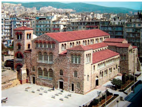
Άγιος Δημήτριος, Θεσσαλονίκη (7 ος αι. μ.Χ.)

Κάθε αρχιτεκτονικό έργο εκφράζει με τη μορφή του τις ανάγκες των ανθρώπων που το δημιουργούν. Ο αρχαιοελληνικός ναός δημιουργήθηκε για να στεγάζει το άγαλμα του θεού και να προστατεύει το θησαυρό της πόλης. Στο εσωτερικό του έμπαιναν μόνον οι ιερείς και όσοι πρόσφεραν δώρα και αναίμακτες θυσίες στο άγαλμα του θεού, ενώ το πλήθος των προσκυνητών έμενε απ' έξω, γύρω από το βωμό για τις αιματηρές θυσίες. Από εκεί έβλεπε μέσα από την ανοιχτή θύρα το πελώριο άγαλμα του θεού. Ο χριστιανικός ναός διαφοροποιήθηκε γιατί είναι «εκκλησία», δηλαδή το κτίριο και συνάμα η σύναξη των πιστών, οι οποίοι δεν παρακολουθούν από έξω σαν θεατές, αλλά συμμετέχουν στο τελούμενο μυστήριο της Θείας Ευχαριστίας. Η έμφαση λοιπόν της καλλιτεχνικής διαμόρφωσης δόθηκε στον εσωτερικό χώρο, ο οποίος δεν είναι απλά το μαρμαροχτισμένο μέγαρο, η κατοικία ενός θεού, αλλά η μικρογραφία του Σύμπαντος, γιατί εδώ γίνεται η συνάντηση του ενός και μοναδικού Θεού με τον άνθρωπο.