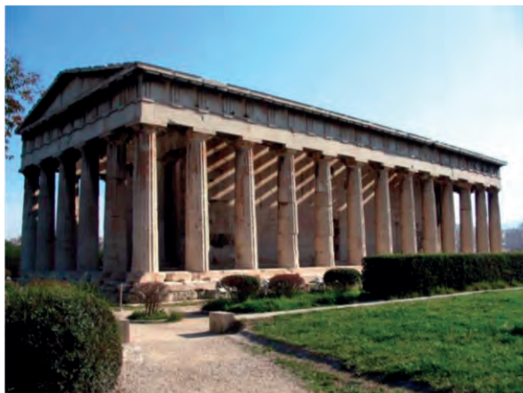
Ναός του Ηφαίστου, Αθήνα (5 ος αι. π.Χ.)

ι. Από τον περίπτερο αρχαιοελληνικό ναό στη χριστιανική βασιλική: Η Αγία Σοφία της Κωνσταντινούπολης ως ζωντανό σύμβολο του χριστιανικού βυζαντινού πολιτισμού