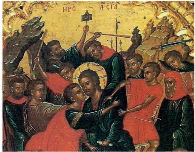
Η προδοσία (λεπτομέρεια, Θεοφάνης ο Κρης, Ι. Μ. Ιβήρων, 16 ος αι.)