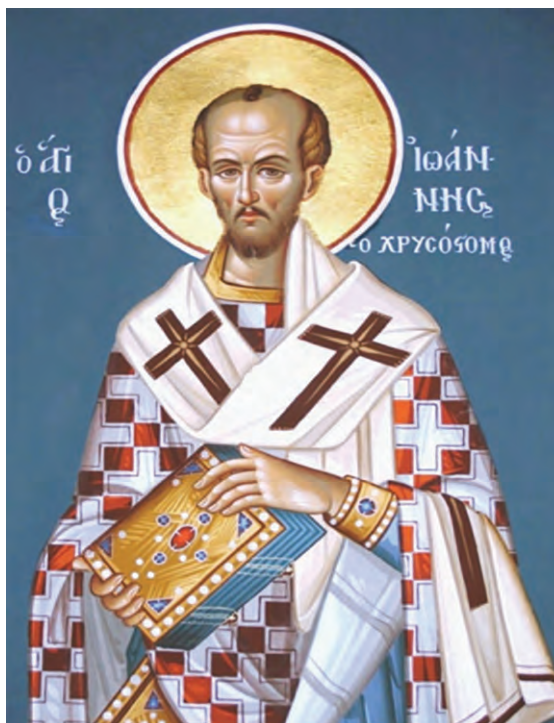
Ο άγιος Ιωάννης ο Χρυσόστομος

άλλη το ανώνυμο πλήθος των φτωχών –χωριστά το πλήθος των δούλων– που κυριολεκτικά πεθαίνουν στους δρόμους από την πείνα και την εγκατάλειψη. Η συνείδησή του εξεγείρεται. Διαμαρτύρεται, καταγγέλλει, δραστηριοποιείται για να ανακουφίσει τους πάσχοντες. Στις μέρες του η Εκκλησία της Αντιόχειας έτρεφε τρεις χιλιάδες φτωχούς [...]