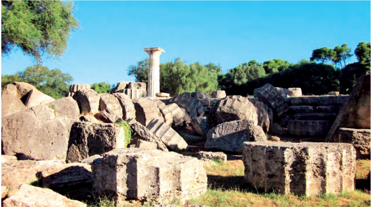
Ερείπια του αρχαίου ναού του Δία στην Ολυμπία

Γρηγόριος Ναζιανζηνός, Α' Κατὰ Ιουλιανού .