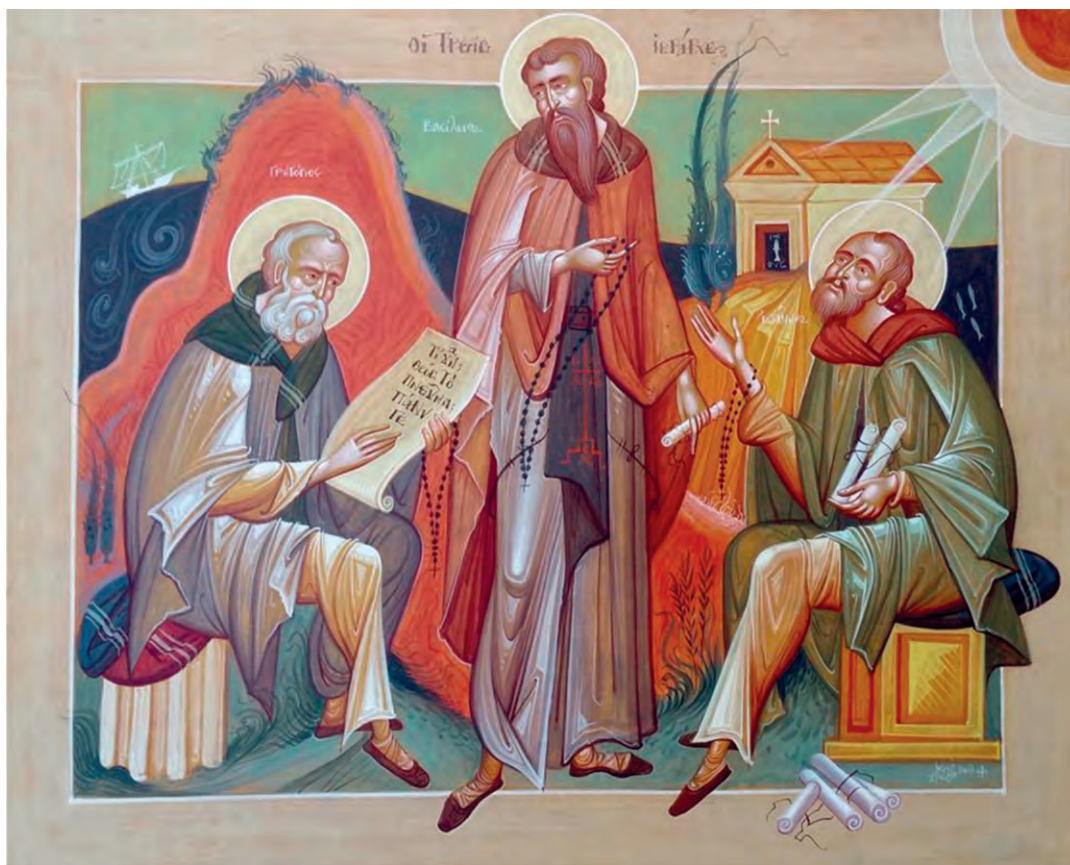
Οι Τρεις Ιεράρχες ως μοναχοί Θεολόγοι (Γεώργιος Κόρδης)

Το 1842 το Πανεπιστήμιο Αθηνών καθιέρωσε για όλη την ελεύθερη Ελλάδα την εορτή των Τριών Ιεραρχών ως ημέρα αφιερωμένη στην Παιδεία και στα Γράμματα. Από τότε ως σήμερα, οι Τρεις Ιεράρχες θεωρούνται προστάτες των μαθητών, των φοιτητών και γενικά όσων σπουδάζουν, και η μέρα της κοινής μνήμης τους (30 Ιανουαρίου) είναι σχολική γιορτή.