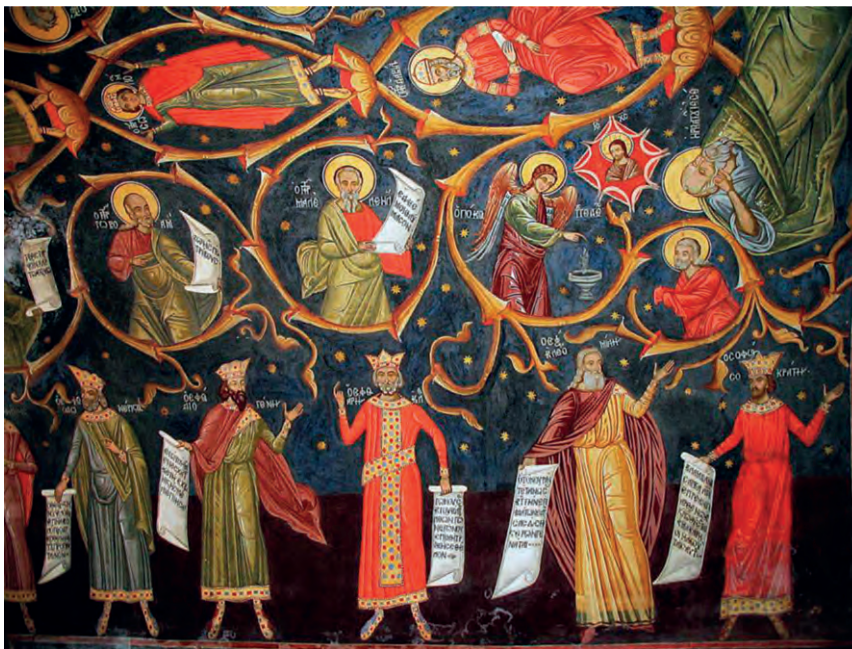
Έλληνες φιλόσοφοι (Μπάντσκοβο Βουλγαρίας, 17 ος αι.)