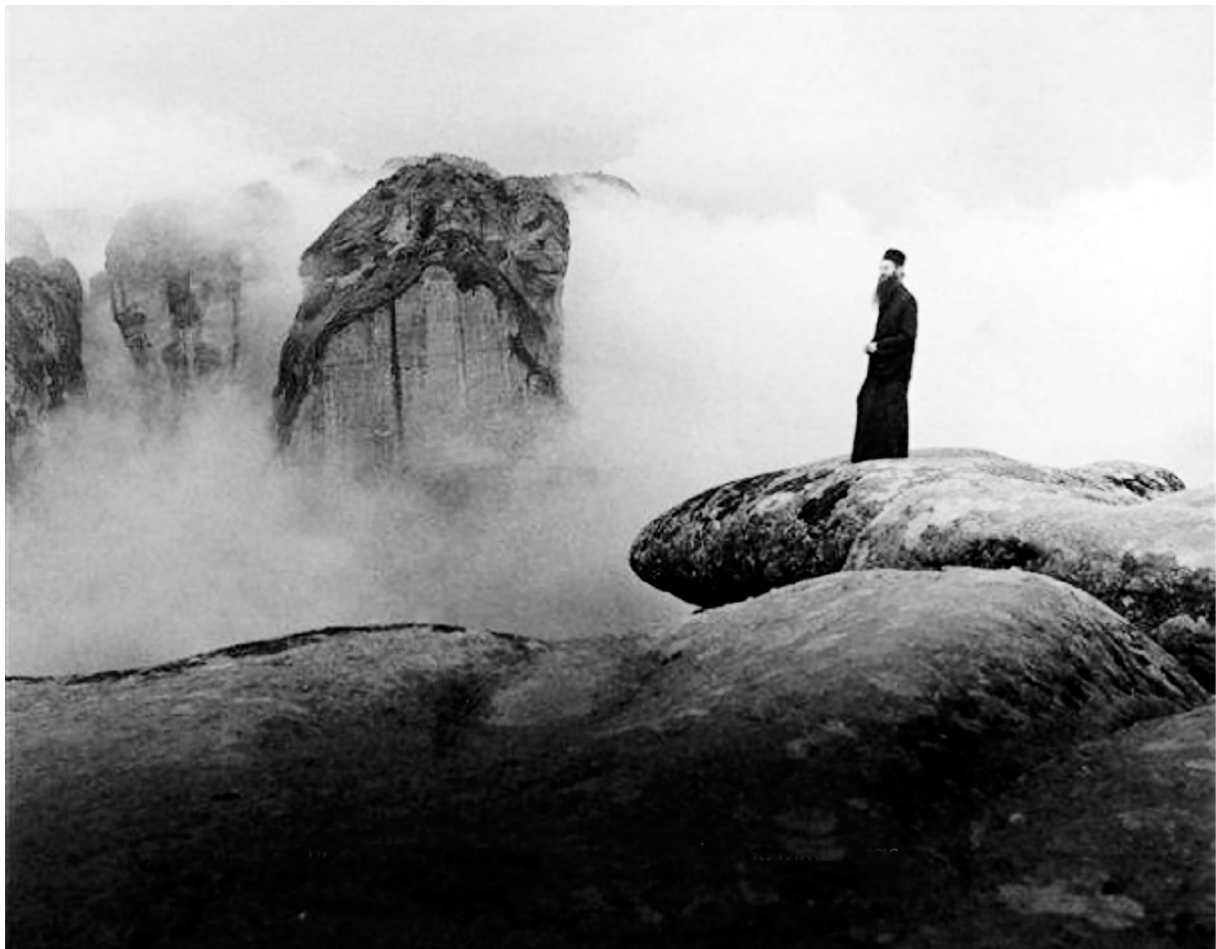
Στις κορυφές των βράχων, Μετέωρα