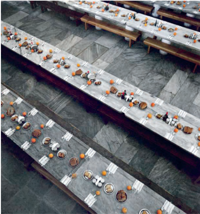
Εορταστική τράπεζα Ιεράς Μονής Ιβήρων για τη γιορτή των Θεοφανείων (Φωτ. Σταύρος Καλαφάτης)

Από πολύ νωρίς στους κύκλους των αναχωρητών έγινε κατανοητό ότι δεν μπορεί κανείς να προσεγγίσει τον Θεό ερήμην του πλησίον. Αυτό οδήγησε στην κοινοβιακή μορφή του μοναχισμού. Ο Παχώμιος ήταν ο πρώτος που ίδρυσε στην Αίγυπτο μοναστήρια, όπως τα γνωρίζουμε σήμερα. Στη συνέχεια, ο Μέγας Βασίλειος θεμελίωσε το κοινοβιακό σύστημα και καθόρισε τις βασικές αρχές του. Μεταξύ άλλων, όρισε ως προϋποθέσεις της μοναχικής ζωής την εγκράτεια, την υπακοή και την ακτημοσύνη. Επιπλέον, παρακινούσε τα μοναστήρια να φροντίζουν τους αρρώστους και τους φτωχούς, να ιδρύουν νοσοκομεία και ορφανοτροφεία, υπηρετώντας έτσι το καλό όλης της κοινωνίας. Η αγάπη του μοναχού απευθυνόταν σε κάθε άνθρωπο, κάτι που το βλέπουμε κυρίως στους μοναστικούς κανόνες για τη φιλοξενία. Έτσι, οι γέροντες της ερήμου προσκυνούσαν τους επισκέπτες τους, αναγνωρίζοντας στο πρόσωπο κάθε ξένου και φτωχού τον ίδιο τον Θεό, ενώ οι αδελφοί του Παχώμιου έπλεναν τα πόδια των επισκεπτών.