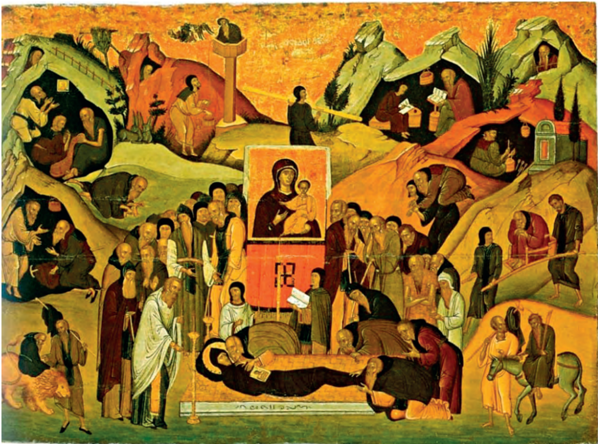
Η κοίμηση του Αγίου Εφραίμ του Σύρου, Α. Παβίας (16 ος αι.)

Ο Εφραίμ ήταν ένας ασκητής που γεννήθηκε στη Νίσιβι και μόνασε στην Έδεσσα της Μεσοποταμίας. Παρά τη σκληρότητα της ασκητικής ζωής του, ήταν πάντοτε τρυφερός στις σχέσεις του με τους άλλους. Ακόμα και στις προτροπές του για μετάνοια δεν καταγγέλλει τους αμαρτωλούς, αλλά προσπαθεί να μαλακώσει τις καρδιές τους και να συγκινήσει τις ψυχές τους.