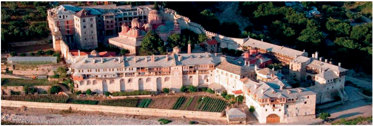
Ι. Μ. Ξενοφώντος, Άγιον Όρος