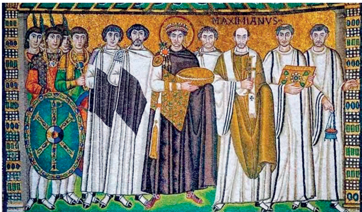
Ο Ιουστινιανός και η συνοδεία του, Άγιος Βιτάλιος της Ραβέννας (6 ος αι.)