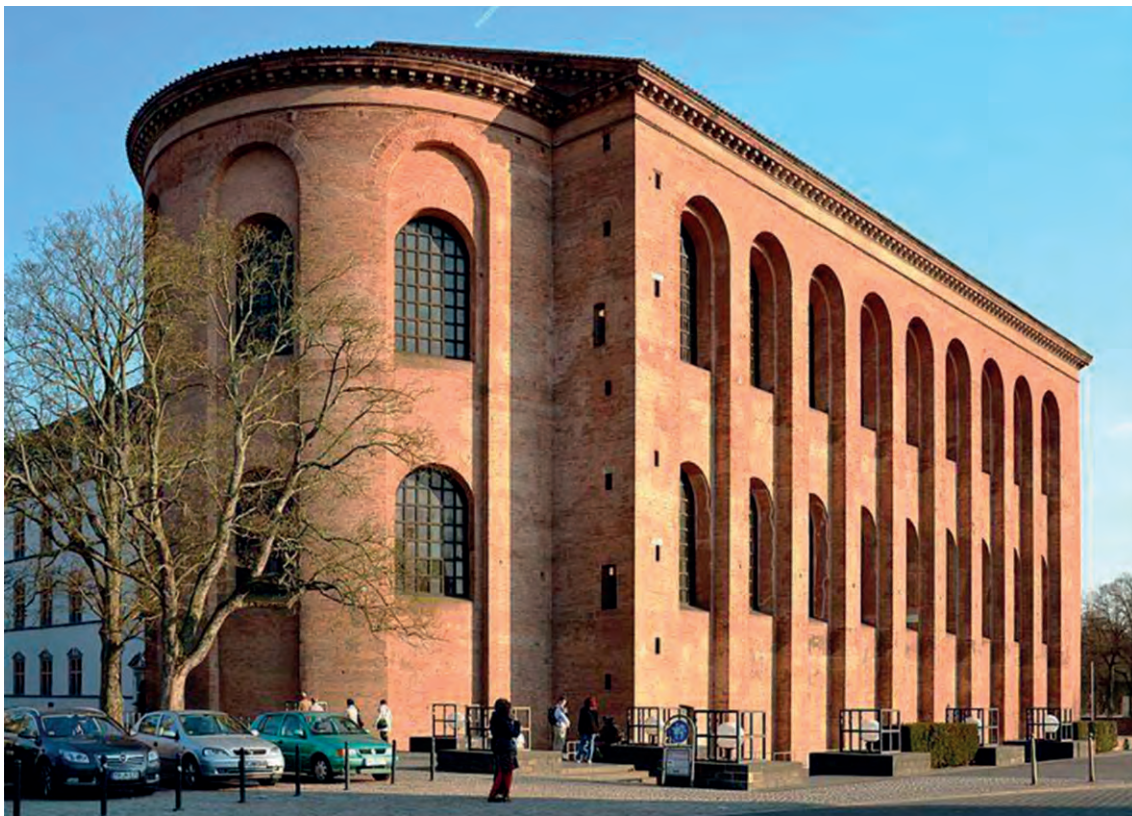
Στη Βασιλική (Basilica) της Τρίερ (στη σημερινή Γερμανία) ήταν η αίθουσα του θρόνου του Μεγάλου Κωνσταντίνου. Η UNESCO την έχει χαρακτηρίσει «μνημείο παγκόσμιας πολιτιστικής κληρονομιάς»

Λ. Τσιακσίρας - Ζ. Ορφανουδάκης - Μ. Θεοχάρη, Ιστορία Ρωμαϊκή και Βυζαντινή .