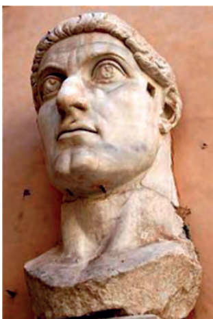
Κεφάλι κολοσσικού αγάλματος του Μεγάλου Κωνσταντίνου, Μουσεία Καπιτωλίου - Αυλή του Παλατιού των Συγκλητικών (Palazzo dei Conservatori) στη Ρώμη, περ. 330 μ.Χ.