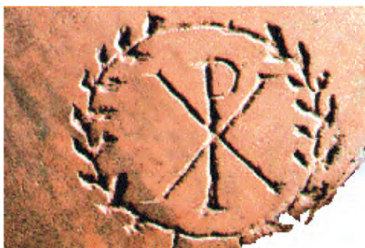
Το σύμβολο «Χ» και «Ρ» μαζί με το «Α» και το «Ω» σε σαρκοφάγο του 4ου αιώνα, Μουσεία του Βατικανού