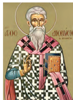
Ο Άγιος Διονύσιος ο Αρεοπαγίτης

Πηγή: Σωτήριος Δεσπότης / Νικόλαος Παύλου / Αθανάσιος Στογιαννίδης, Θέματα από την Αγία Γραφή. Α' Εκκλησιαστικού Γυμνασίου (υπό έκδοση), σελ. 207.