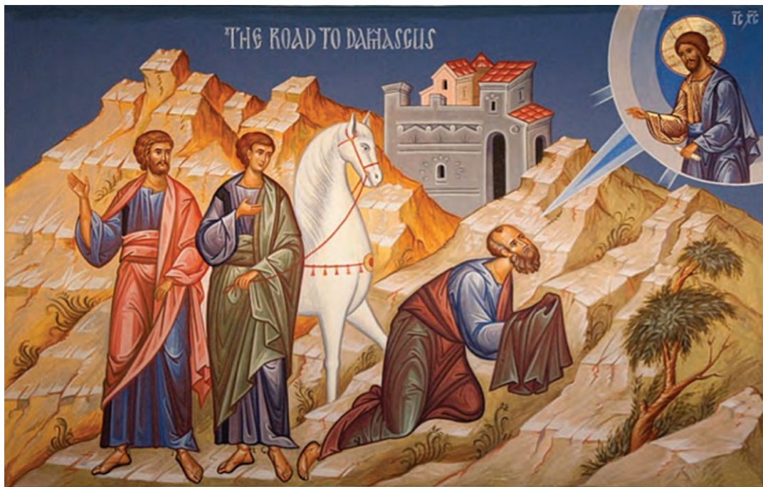
Η πορεία του Παύλου προς τη Δαμασκό

Έχετε ακούσει για τον Απόστολο Παύλο; Γνωρίζετε κάποια πράγματα για τη ζωή του; Ας δούμε το κείμενο που ακολουθεί: «Στο μεταξύ ο Σαύλος συνέχιζε να έχει απειλητικές και φονικές διαθέσεις για τους μαθητές του Κυρίου· πήγε στον αρχιερέα και του ζήτησε συστατικές επιστολές για τις συναγωγές στη Δαμασκό. Όποιους θα 'βρισκε εκεί να ακολουθούν την οδό του Κυρίου, άντρες και γυναίκες, ήθελε να τους φέρει δεμένους στην Ιερουσαλήμ» (Πράξ 9, 1-2).