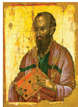
Απόστολος Παύλος (Θεφάνης ο Κρης, 16 ος αι.). Ι. Μ. Σταυρονικήτα, Άγιον Όρος