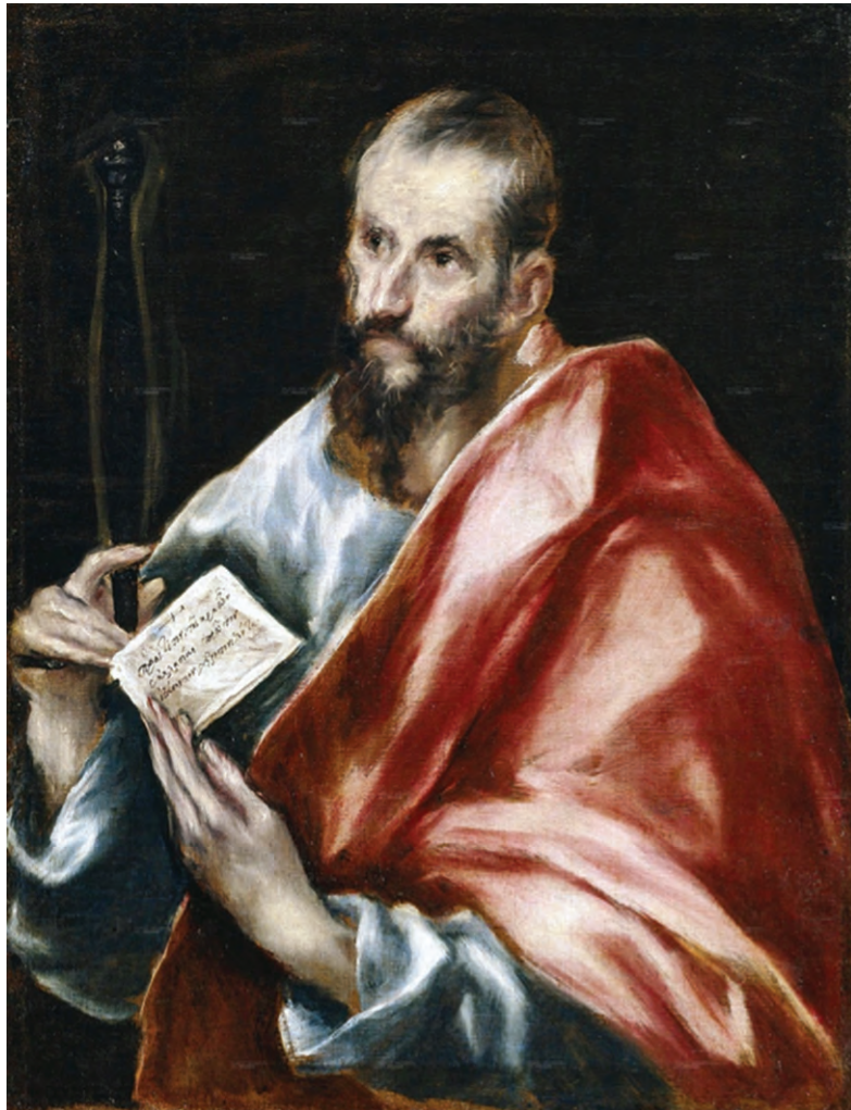
Ο Απόστολος Παύλος (Δομήνικος Θεοτοκόπουλος)