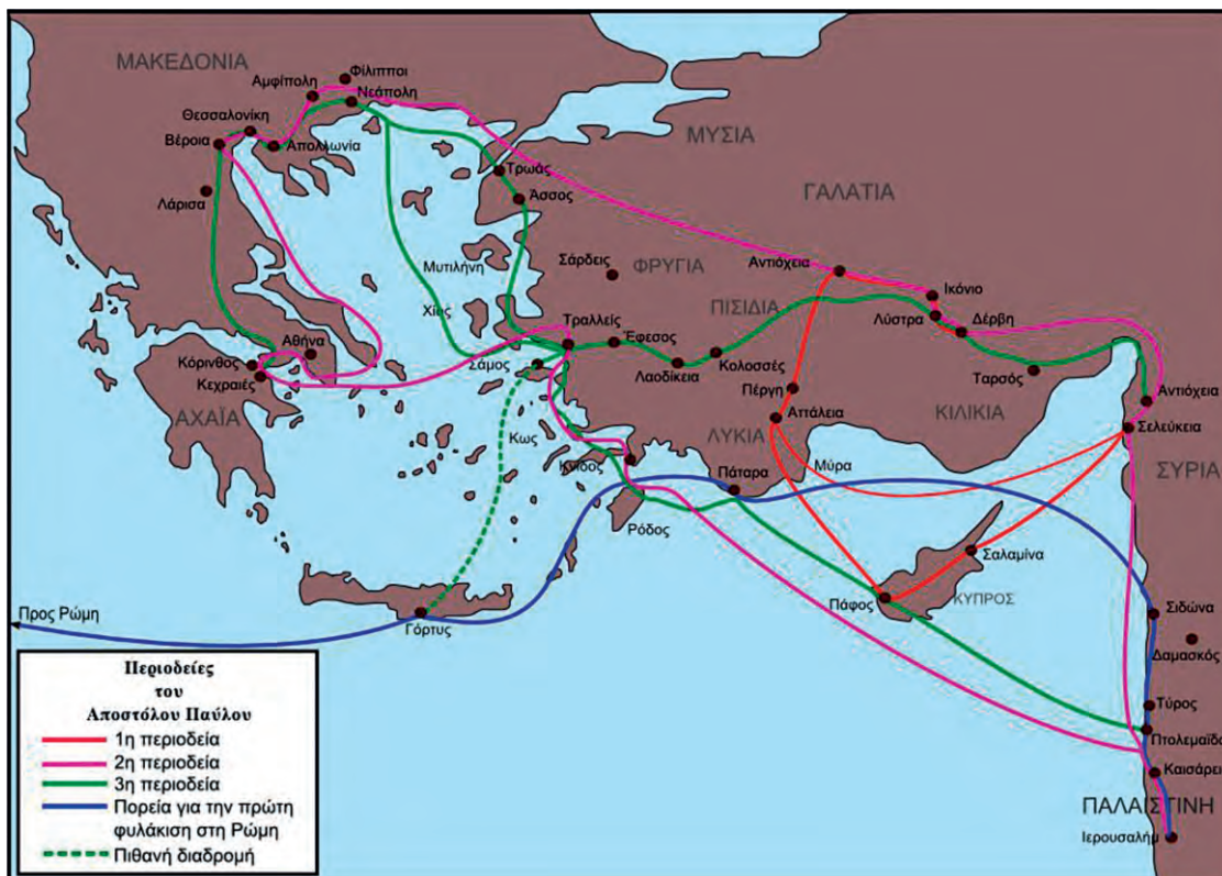
Οι Ιεραποστολικές Περιοδείες του Αποστόλου Παύλου

«[...] κατέβηκαν στην Τρωάδα. Εκεί ο Παύλος είδε τη νύχτα ένα όραμα: ένας Μακεδόνας στεκόταν μπροστά του και τον παρακαλούσε λέγοντας: «Πέρασε στη Μακεδονία και βοήθησε μας». [...] Από την Τρωάδα αποπλεύσαμε και πήγαμε κατευθείαν στη Σαμοθράκη και την επόμενη στη Νεάπολη.