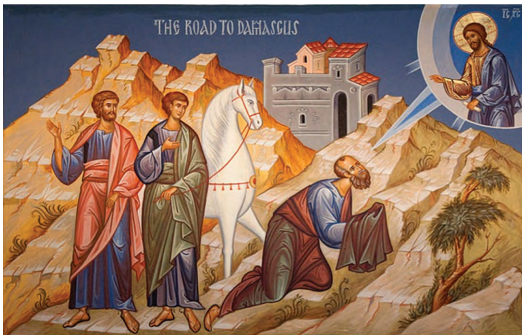
Η πορεία του Παύλου προς τη Δαμασκό

Έχετε ακούσει για τον Απόστολο Παύλο; Γνωρίζετε κάποια πράγματα για τη ζωή του; Ας δούμε το κείμενο που ακολουθεί: «Στο μεταξύ ο Σαύλος συνέχιζε να έχει απειλητικές και φονικές διαθέσεις για τους μαθητές του Κυρίου· πήγε στον αρχιερέα και του ζήτησε συστατικές επιστολές για τις συναγωγές στη Δαμασκό. Όποιους θα 'βρισκε εκεί να ακολουθούν την οδό του Κυρίου, άντρες και γυναίκες, ήθελε να τους φέρει δεμένους στην Ιερουσαλήμ» (Πράξ 9, 1-2).