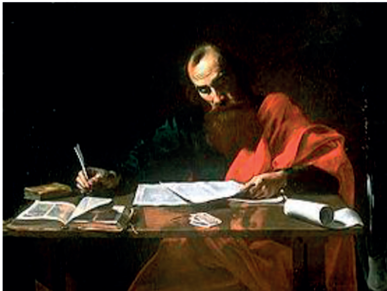
Ο άγιος Παύλος συγγράφει τις Επιστολές του (Valentin de Boulogne)

Ουσιαστικά, κάνει κάτι πολύ «αλλόκοτο» για την εποχή του: παρουσιάζει ένα όργανο ατιμωτικό, όργανο θανάτου, δηλ. τον σταυρό, ως το κατεχοχόν μέσο της σωτηρίας. Δεν είναι όμως ένας οποιοσδήποτε σταυρός, αλλά ο σταυρός του Χριστού, που πέθανε και αναστήθηκε για χάρη του ανθρώπου. Γι' αυτόν ακριβώς τον λόγο, ομολογεί ότι: