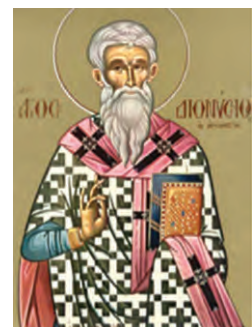
Ο Άγιος Διονύσιος ο Αρεοπαγίτης

Πηγή: Σωτήριος Δεσπότης / Νικόλαος Παύλου / Αθανάσιος Στογιαννίδης, Θέματα από την Αγία Γραφή. Α' Εκκλησιαστικού Γυμνασίου (υπό έκδοση), σελ. 207.