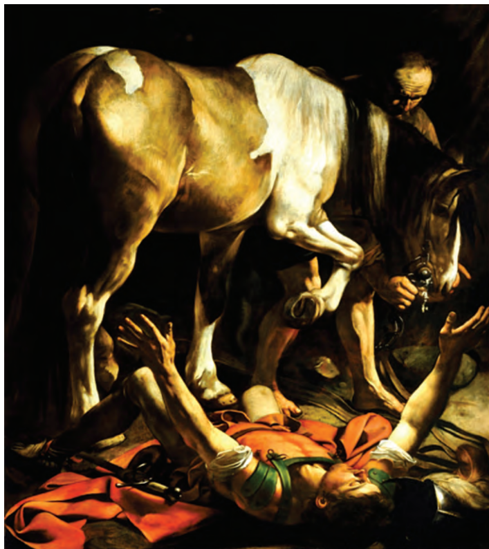
Η μεταστροφή του Αποστόλου Παύλου (Caravaggio)

Ό,τι έκανε, το έπραττε με απόλυτη αφοσίωση· ήταν ολοκληρωτικά δοσμένος σε ό,τι θεωρούσε αληθινό και ηθικό. Αυτό σημαίνει ότι είχε ειλικρινή καρδιά. Κάποια ημέρα, καθώς πηγαίνει με συνοδεία φρουρών από τα Ιεροσόλυμα προς τη Δαμασκό για να συλλάβει χριστιανούς, του αποκαλύπτεται ο ίδιος ο Χριστός. Εκεί συμβαίνει το συγκλονιστικό γεγονός, που διαβάζουμε παρακάτω, και το οποίο άλλαξε όχι μόνο τη ζωή του Σαούλ, αλλά και όλου του κόσμου: