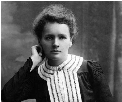
Marie Curie – Φυσικός και χημικός από την Πολωνία διάσημη για τη δουλειά της στην ραδιενέργεια και κάτοχος 2 βραβείων Νόμπελ.