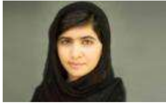
Malala Yousafzai – Ακτιβίστρια από το Πακιστάν, υπέρμαχος για την πρόσβαση των κοριτσιών στην εκπαίδευση και το νεότερο άτομο που έχει τιμηθεί ποτέ με βραβείο Νόμπελ.