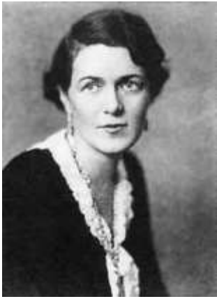
Caresse Crosby – Η εφεύτρια του πρώτου μοντέρνου σουτιέν με κατοχυρωμένο δίπλωμα ευρεσιτεχνίας το 1914 έμελλε να κάνει τις ζωές μας πιο εύκολες.