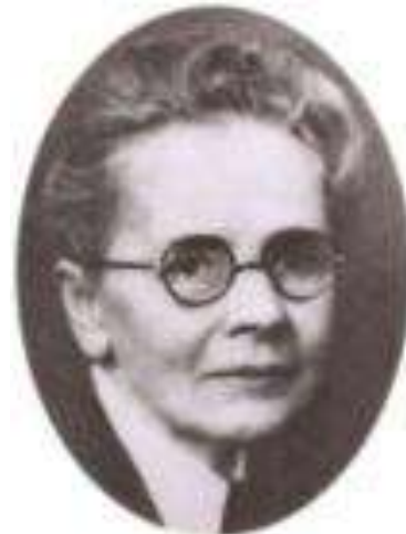
Julia Morgan – Μια από τις κορυφαίες προσωπικότητες της αρχιτεκτονικής στην Αμερική επιρεάζοντας σημαντικά τον κλάδο της. Ήταν η πρώτη γυναίκα που έγινε δεκτή στη Σχολή Καλών Τεχνών του Παρισιού, κι έφτιαξε πολλά κολέγια για γυναίκες.