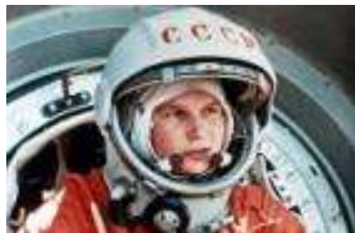
Valentina Tereshkova – Η πρώτη γυναίκα που πήγε στο διάστημα στη ρώσικη αποστολή Vostok 6 (1963).