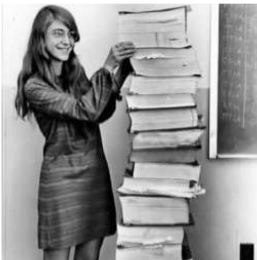
Margaret Heafield – Διευθύντρια Software Engineering για την αποστολή της NASA Apollo 11, με την οποία ο άνθρωπος πάτησε στο φεγγάρι. Ήταν τόσο ακριβής στους υπολογισμούς της που την έβαζαν να τσεκάρει αυτούς των υπολογιστών.