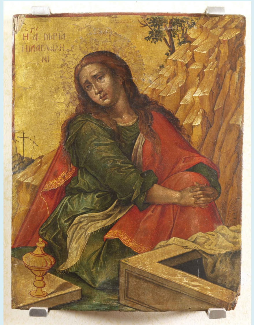
Η αγία Μαρία η Μαγδαληνή