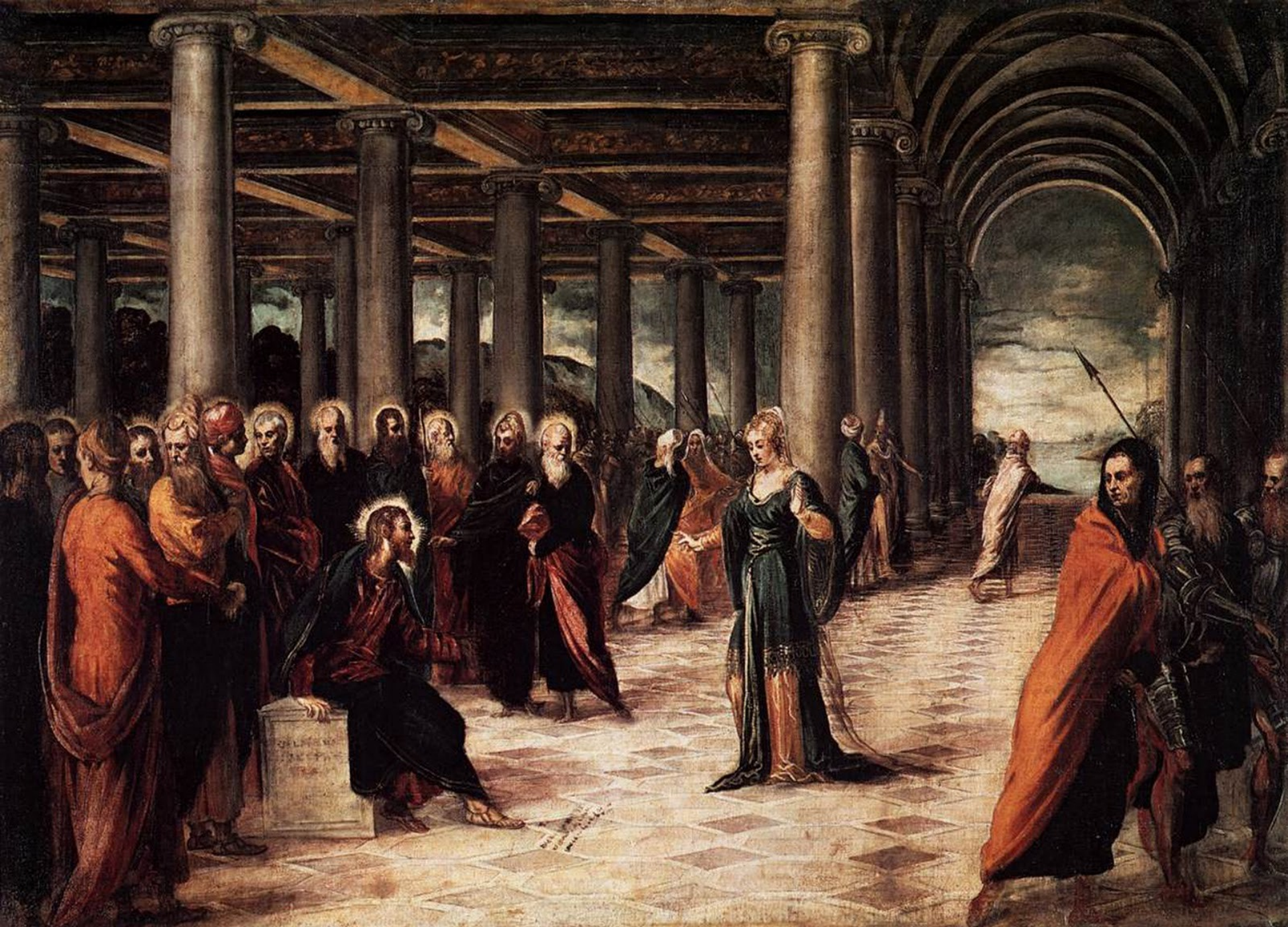
“Ο Χριστός και η μοιχαλίδα” : Τιντορέτο (1518-1594)