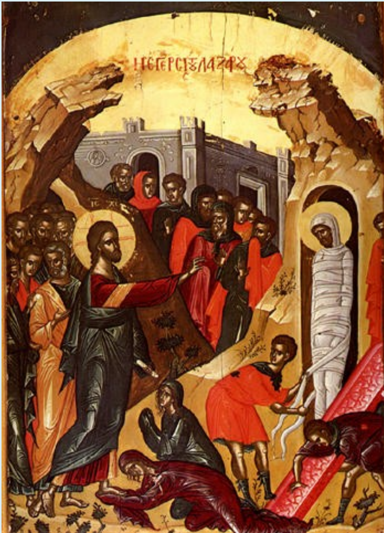
Οι αδελφές του Λαζάρου